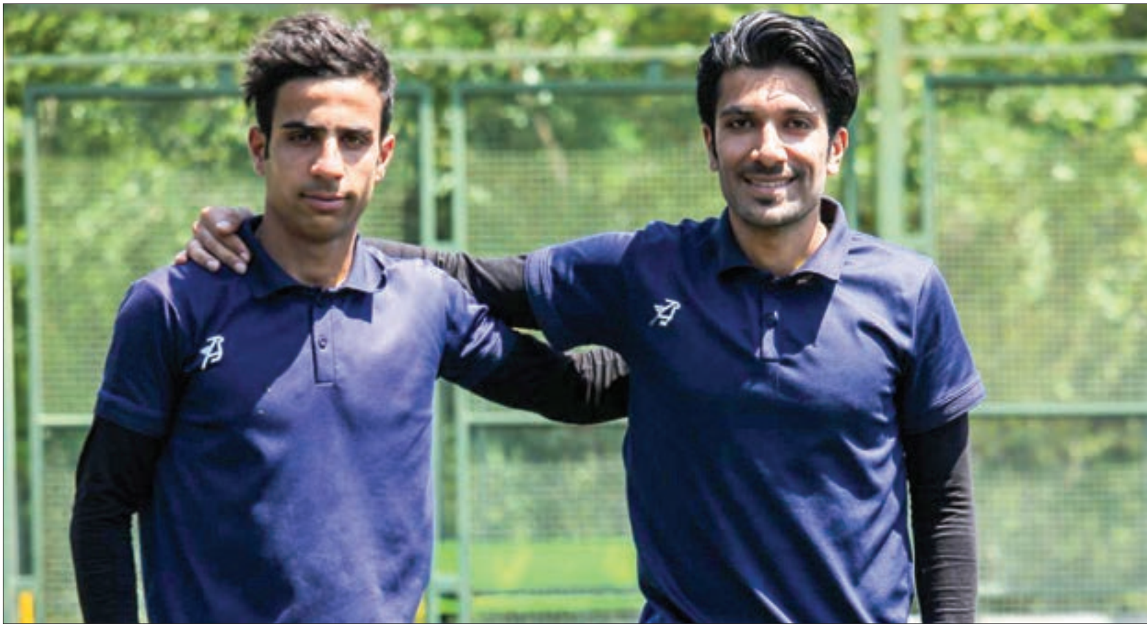
مربیان جوان فوتبال منطقه در گفت‌وگو با شهر آمل مطرح کردند