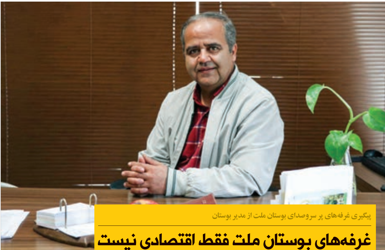
پیگیری غرفه‌های پر سروصدای بوستان ملت از مدیر بوستان