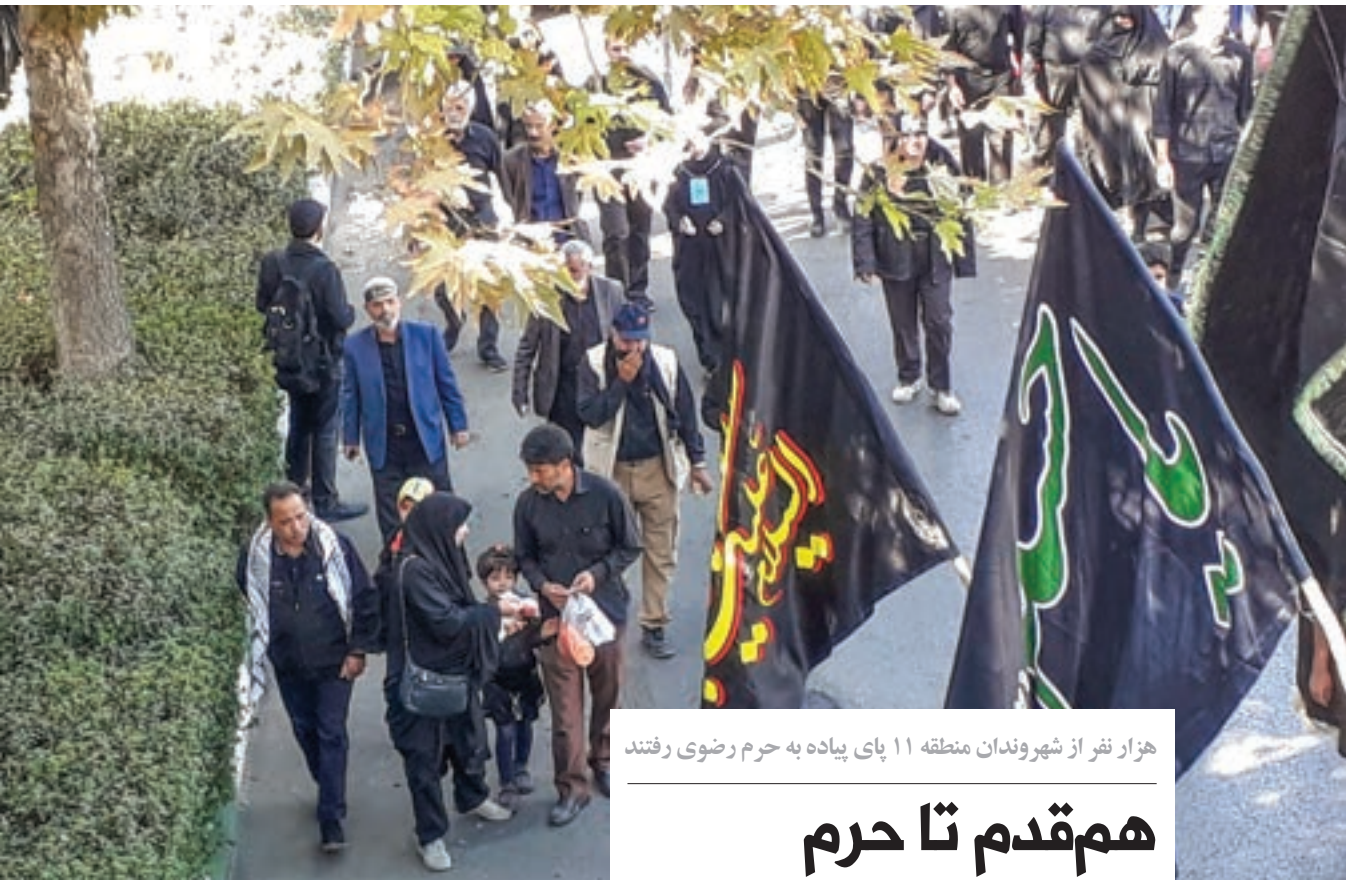
هزار نفر از شهروندان منطقه ۱۱ پای پیاده به حرم رضوی رفتند