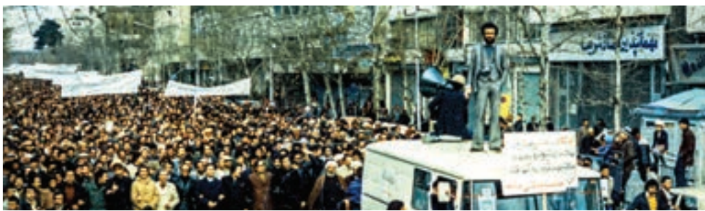
نمایی از تظاهرات مردم مشهد در ۱۰ دی ۱۳۵۷

بررسی حادثه خونین ۱۰ دی ۱۳۵۷ و نقش آن در انقلاب اسلامی