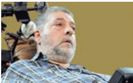
نشان مشهدالرضا (ع) در حوزه ایتار، شهادت و مقاومت