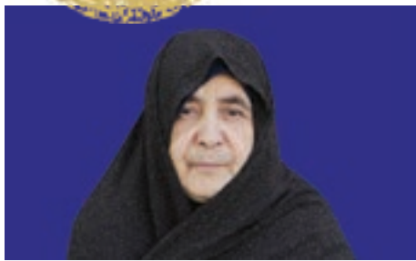
نشان مشهدالرضا (ع) در حوزه ایتار، شهادت و مقاومت

اگر هرکدام از ما جای او بودیم، دست از همه چیز می‌کشیدیم؛ اما او ۳۹ سال است که زخم‌های دفاع مقدس را بر بدن دارد و از پا ننشسته و در عین معلولیت، نه تنها چهار عنوان کتاب تألیف کرده، بلکه طراح اجتماع بزرگ منتظران ظهور است که سالانه در چهارصد شهر ایران برگزار می‌شود. این مرد بزرگ، نماد ایتار و مقاومت است و داستان زندگی او چنان است که هر کسی پیش بزرگی او سر تعظیم فرود می‌آورد.