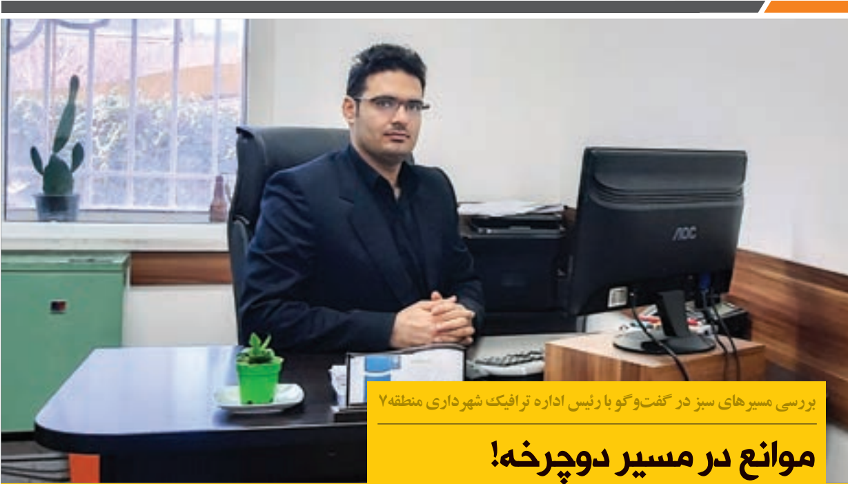
پروسی مسیوهای سبز در گفت و گو با رئیس اداره ترافیک شهرداری منطقه ۷

داد: آخرین بینایی سنجی در تاریخ ۲۶ دی ماه در زینبیه طرق انجام خواهد شد و افرادی که تاکنون همراه فرزندان خود مراجعه نکرده اند، می توانند به این محل مراجعه کنند. وی افزود: به تمامی کودکانی که شرکت کنند، کارت سلامت داده می شود و افرادی که مشکل بینایی داشته باشند نیز رایگان به مراکز درمانی ارجاع خواهند شد.