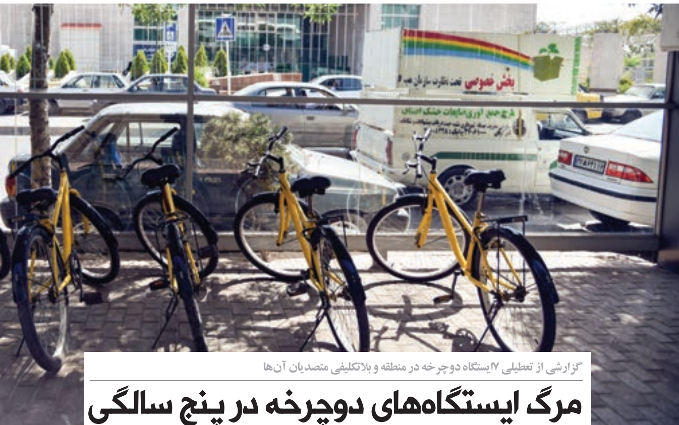
گزارشی از تعطیلی ۱۷ ایستگاه دوچرخه در منطقه و بلا تکلیفی متصدیان آن‌ها