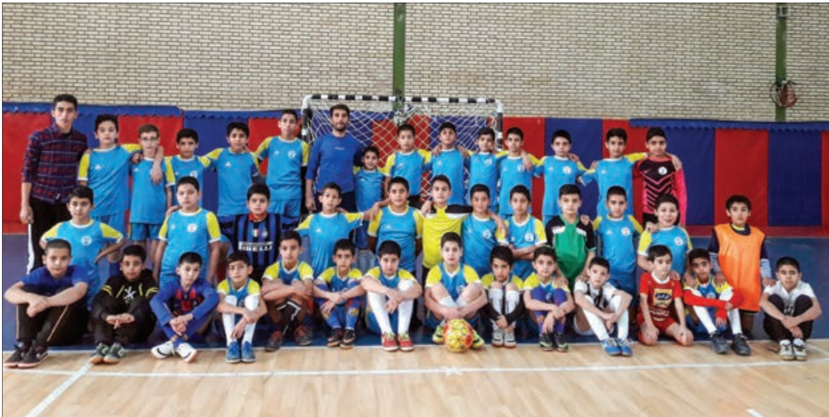
تلاش مربی جوان برای پرورش فوتبالیست‌های آینده در منطقه سیدی