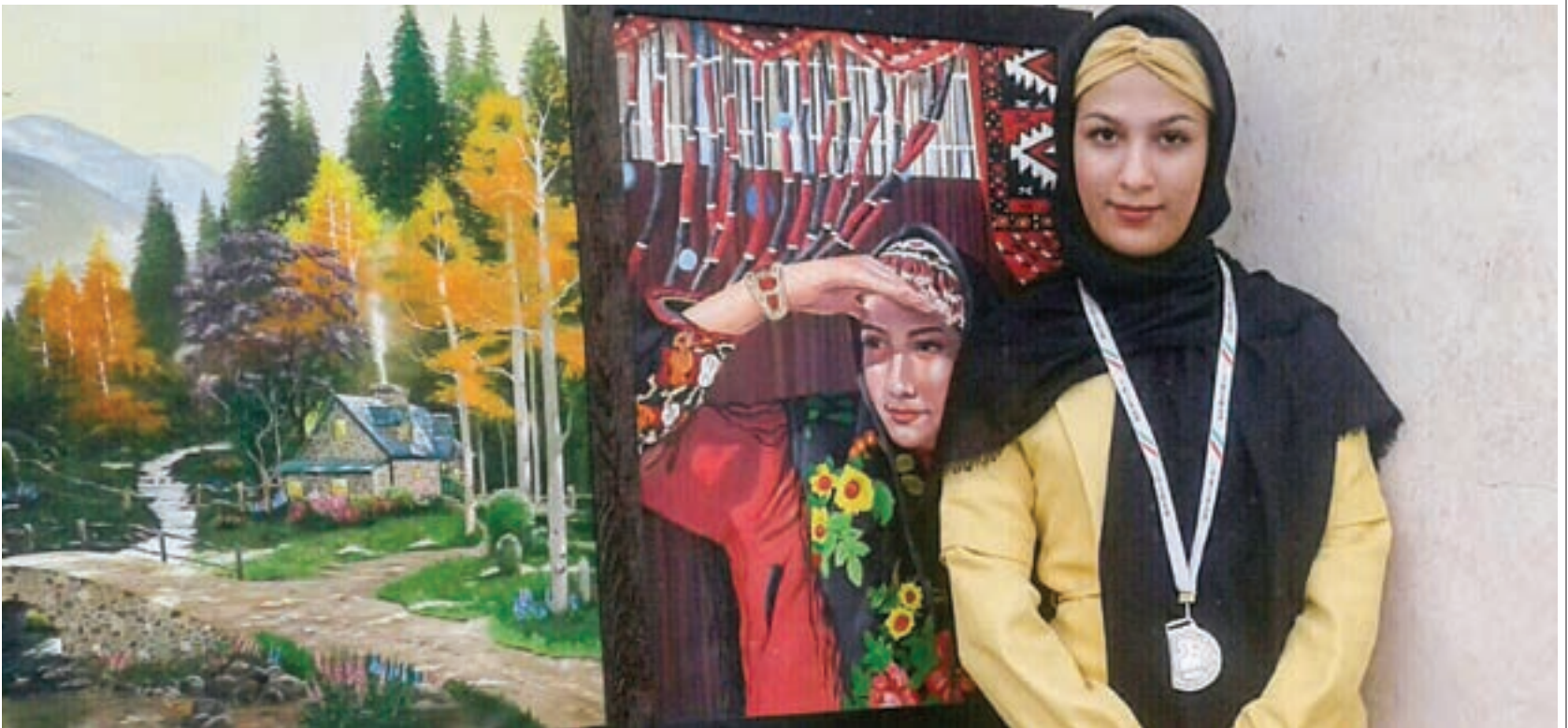
رتبه دوم مسابقات نقاشی کشوری ساکن محله کال زرکش: