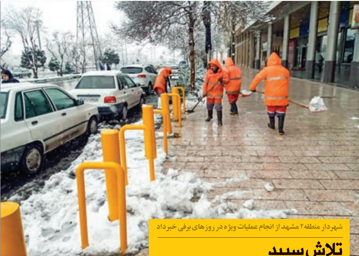
شهردار منطقه ۲ مشهد از انجام عملیات ویژه در روزهای برفی خبر داد

اداره خدمات شهری در مناطق از ادارات پرکار محسوب می شود. در منطقه ما هم اداره خدمات شهری فهرست بلندبالایی از خدمات را ارائه می دهد. نگاهی به عملکرد این اداره تنها در ماه گذشته نشان می دهد خادمان برای سروسامان دادن به اوضاع محلات چقدر تلاش می کنند.