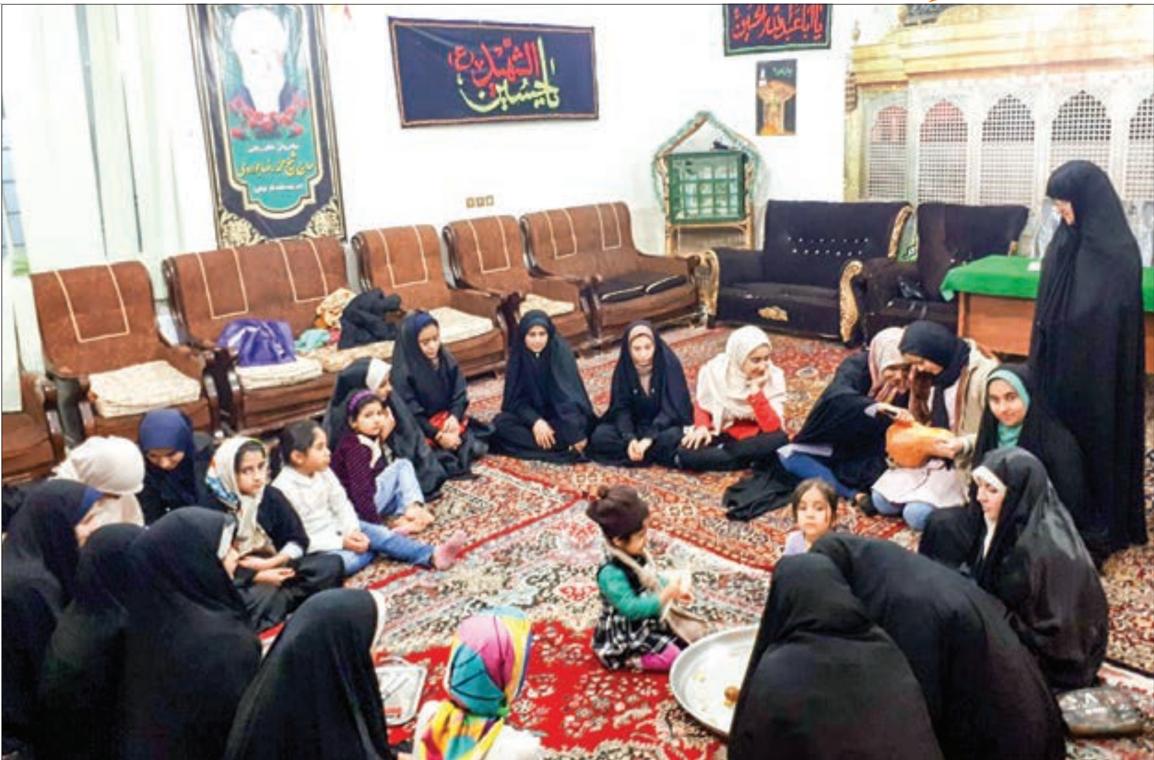
نگاهی به حسینیه حضرت فاطمه (س) در توس ۹۱