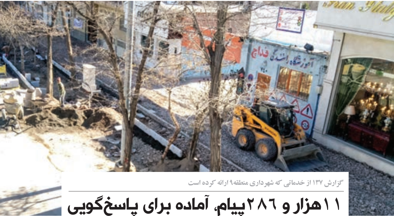
گزارش ۱۳۷ از خدماتی که شهرداری منطقه ۹ ارائه کرده است