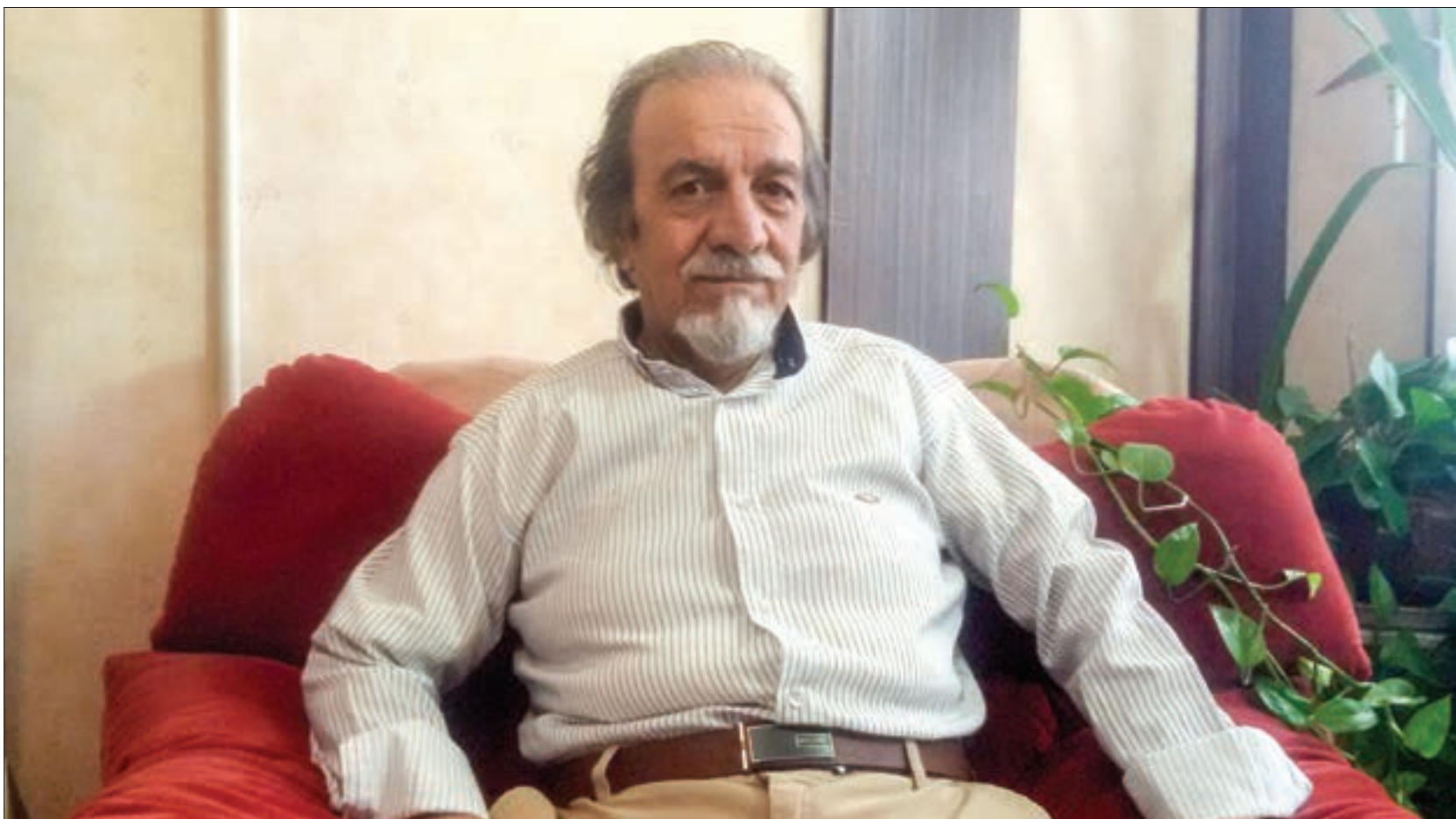
گفت و گو با پیش کسوت تئاتر که به حرفه پرستاری مشغول بوده است