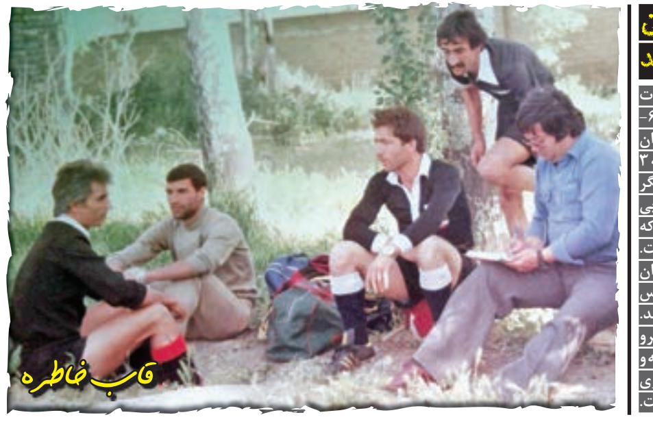
تیم خیز شده است.

عنوان قهرمانی لیگ قهرمانان، تن به شکست ۲ بر صفر داد، حالا باید با تیمی بازی کند که به تیمی جعفر در فوتبال ازبکستان شهره است. پرافتخارترین باشگاه فوتبال ازبکستان فصل گذشته توانست عنوان قهرمانی فوتبال کشورش را برای دوازدهمین بار به دست آورد، تیمی که در نخستین گام این تورنمنت هم هفته گذشته توانست برابر شباب الاهلی امارات به پیروزی آبریک برسد.