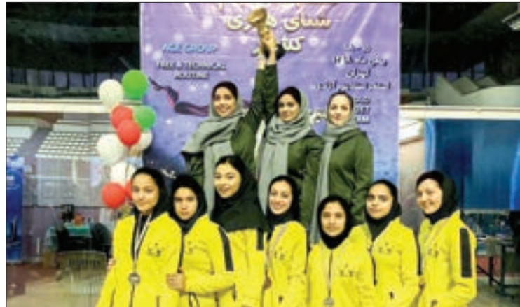
تیم شنا خراسان در مسابقات کشوری