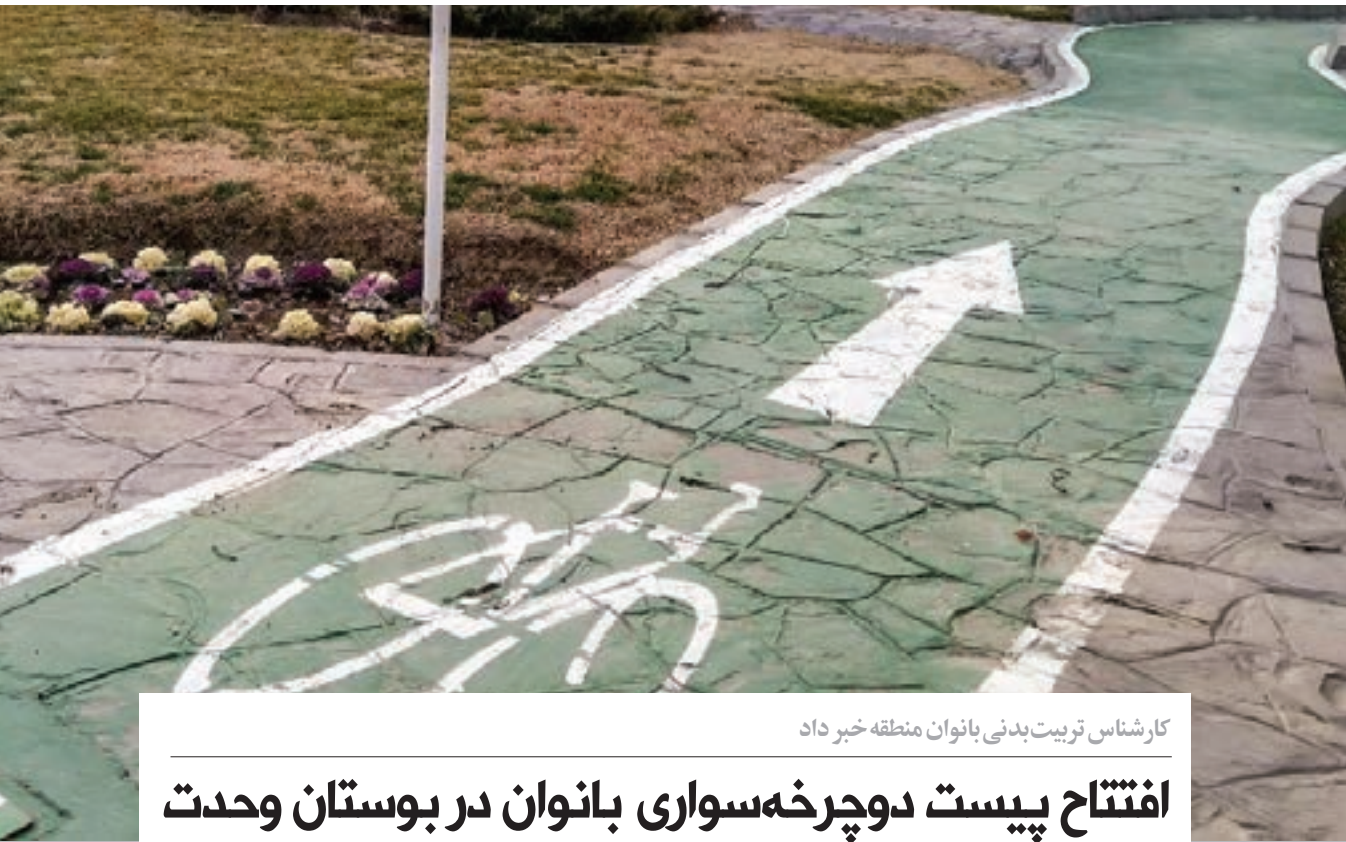
کارشناس تربیت بدنی بانوان منطقه خبر داد