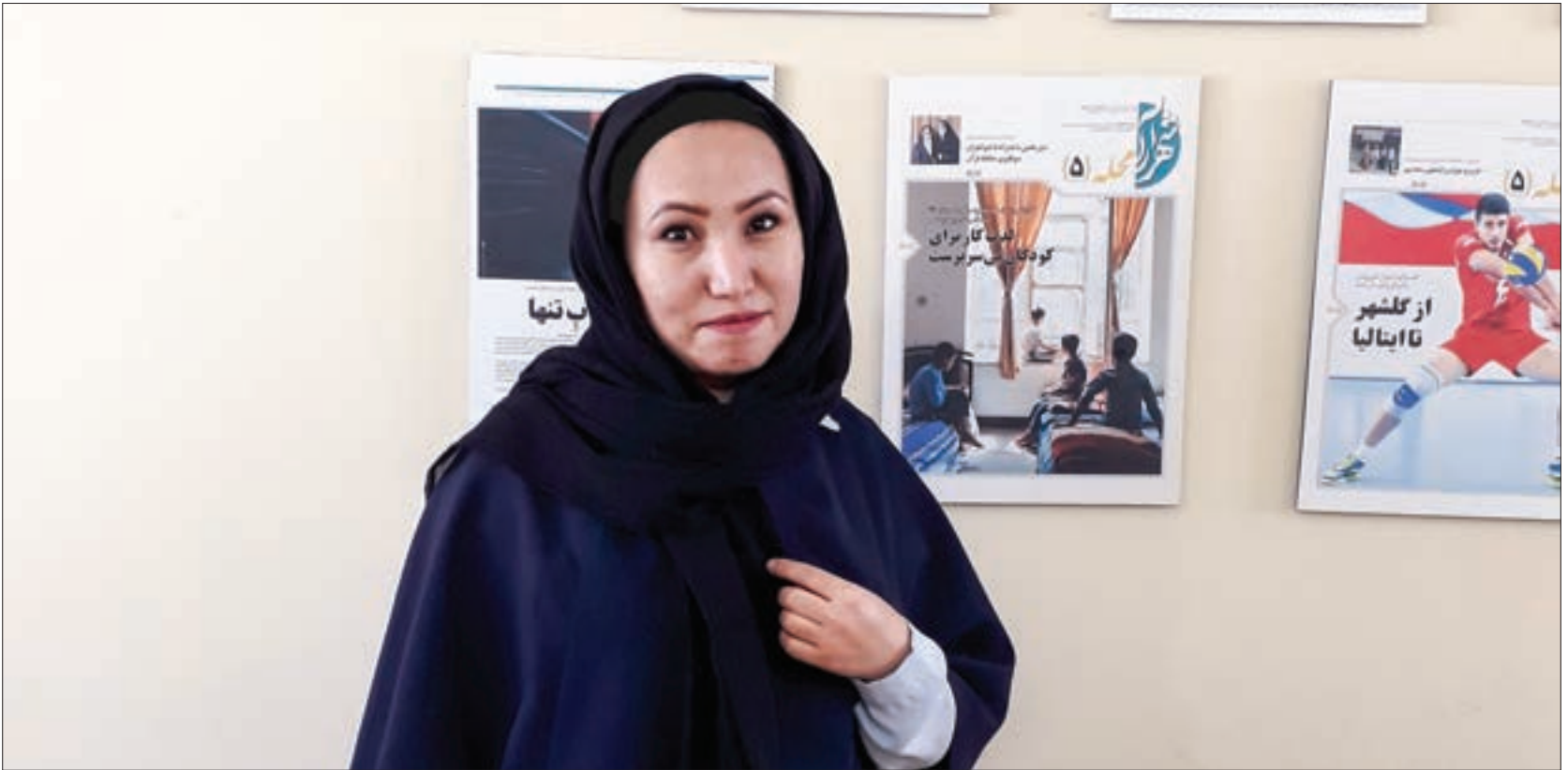
گفت و گو با بانوی دست به قلم گلشهری