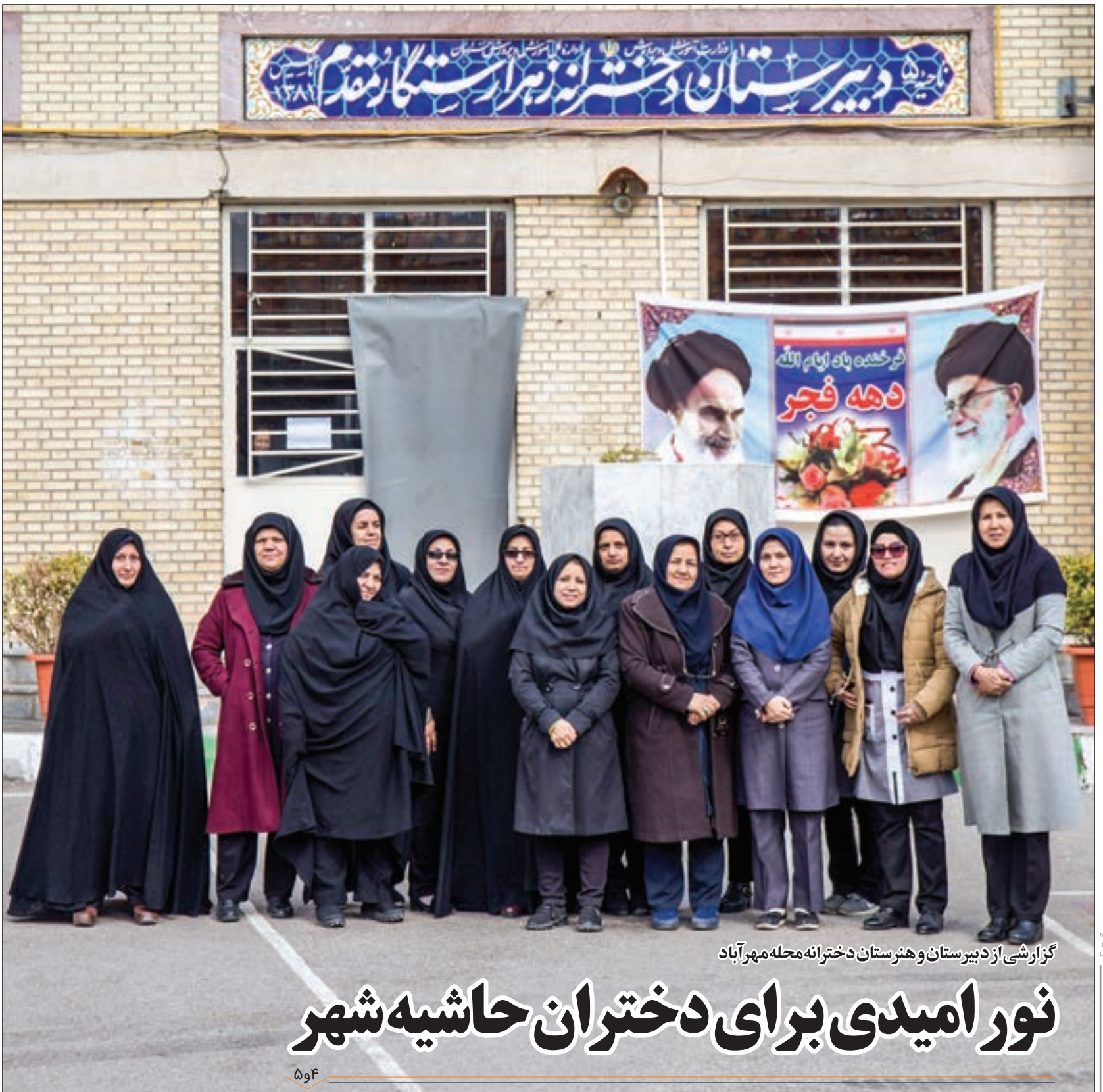
گزارشی از دبیرستان و هنرستان دخترانه محله مهرآباد