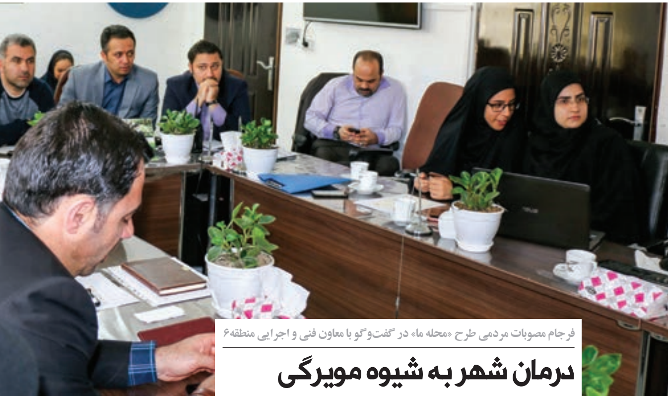
فرجام مصوبات مردمی طرح «محله ما» در گفت و گو با معاون فنی و اجرایی منطقه ۶