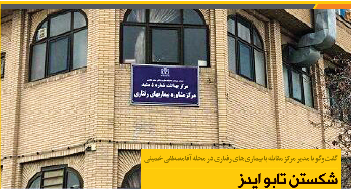
گفت‌وگو با مدیر مرکز مقابله با بیماری‌های رفتاری در محله آقامصطفی خمینی