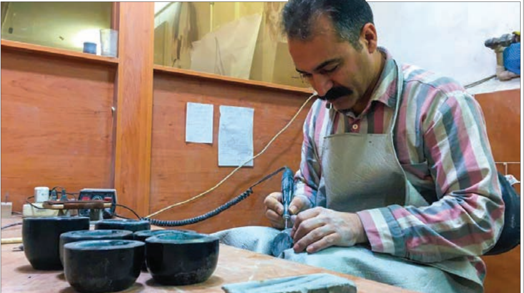
گفت و گو با هنرمند حجاری روی سنگ در مصلی تاریخی