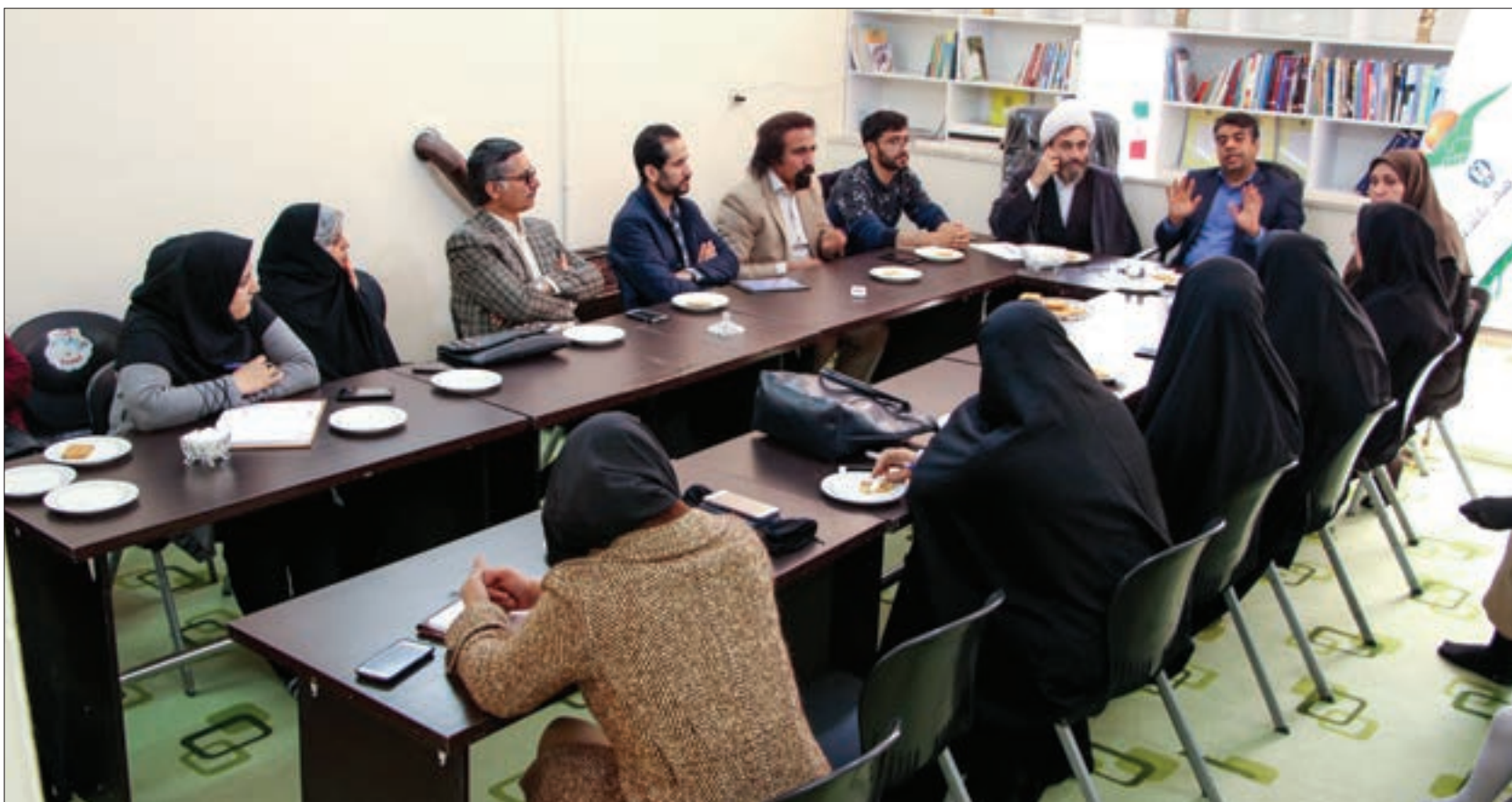
برگزاری نشست با دبیر شورای هماهنگی مبارزه با مواد مخدر استان