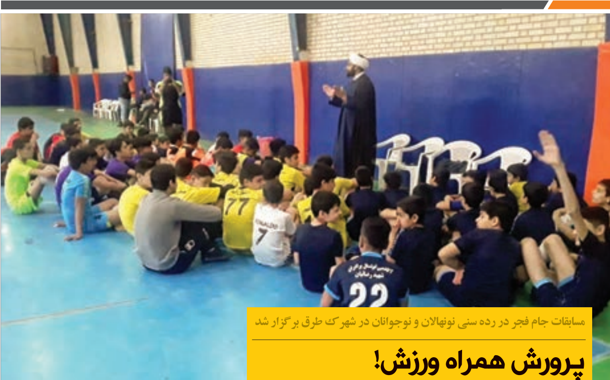
مسابقات جام فجر در رده سنی نونهالان و نوجوانان در شهرک طرق برگزار شد

رئیس اداره اجتماعی و فرهنگی منطقه، وزره‌ساز، مدیرکل کانون پرورش فکری کودکان و نوجوانان استان، برگزار شد. در انتهای این مراسم پرنشاط از طرف شهرداری منطقه هدایایی به دانش آموزان این مدرسه اهدا شد.