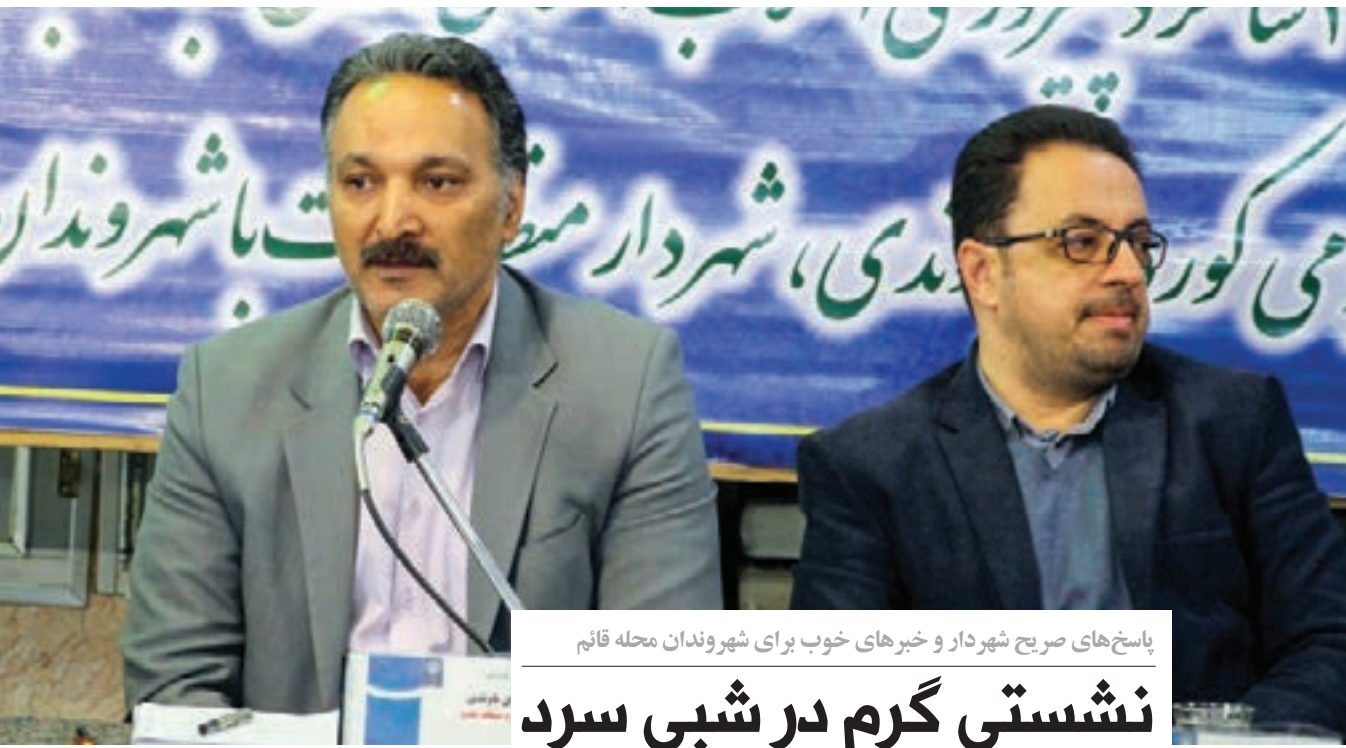
پاسخ‌های صریح شهردار و خبرهای خوب برای شهروندان محله قائم