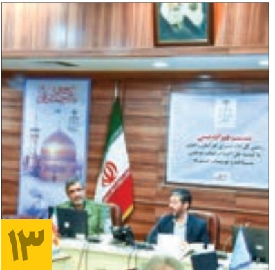
۱۳ هم‌اندیشی برای حل اختلاف