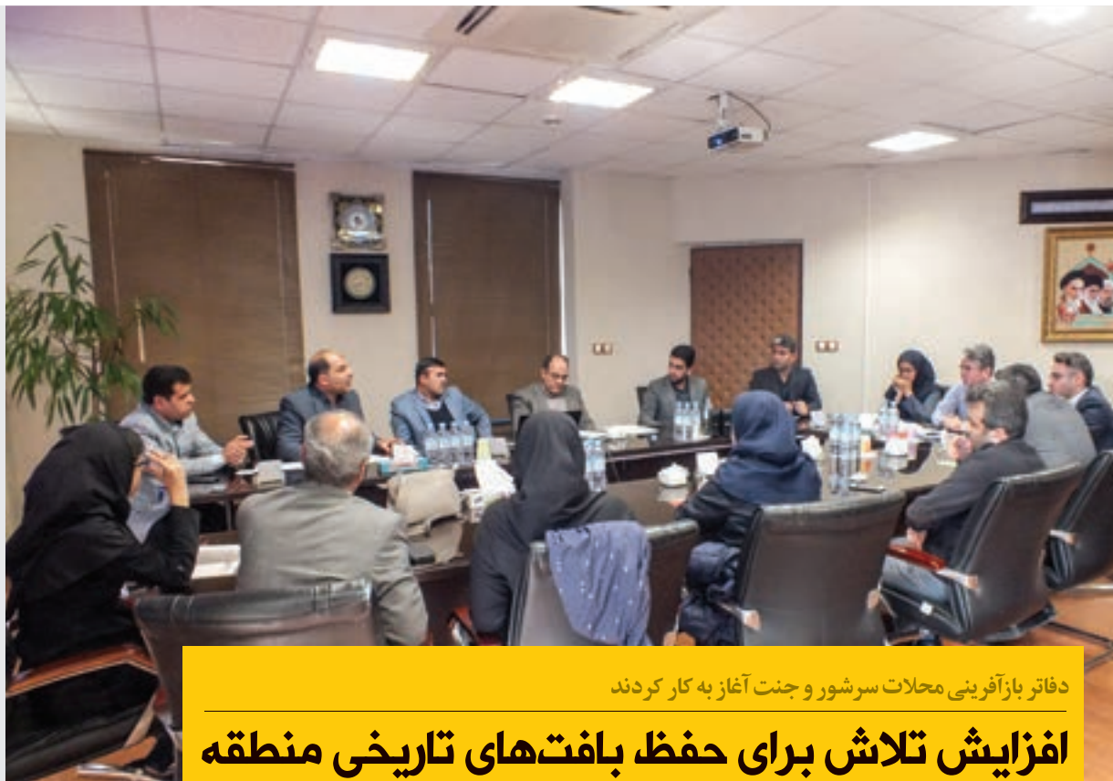
دفاتر بازرگانی محلات سرشور و جنت آغاز به کار کردند