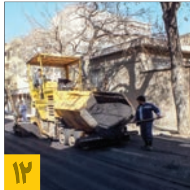
روکش آسفالت معابر فرعی خیابان بهشتی منطقه ۸

به گزارش خبرنگار شهرآرامحله، شریفی با اشاره به اینکه هر ساله در مدارس شاهد مختلف کشور شاهد برگزاری مراسم تجلیل از خانواده شهدا و جانبازان با هدف تکریم و تجلیل از مقام شامخ شهدا هستیم، ادامه داد: در این مراسم دانش آموزان همراه با والدین خود شرکت کرده‌اند تا بیشتر با فرهنگ ایثار و شهادت و همچنین تقویت باورهای دینی و ملی آشنا شوند و جایگاه این مقام را بدانند. وی با بیان اینکه امسال نخستین سالی است که در ناحیه ۳ آموزش و پرورش مشهد این مراسم برگزار می‌شود، گفت: برنامه‌های ویژه‌ای از سوی آموزش و پرورش برای دانش آموزان شاهد، جانباز و ایثارگر در نظر گرفته شده است که از جمله آن‌ها می‌توان به مشاوره تحصیلی و خانوادگی رایگان و همچنین هفته‌ای ۶ ساعت برنامه فوق العاده و تقویتی درسی اشاره کرد.