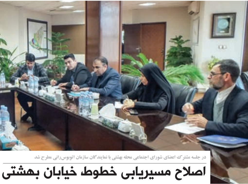
در جلسه مشترک اعضای شورای اجتماعی محله بهشتی با نمایندگان سازمان اتوبوس‌رانی مطرح شد

قوی‌تر بودن استخوان‌ها و ماهیچه‌ها، بدن مستحکم‌تر و با استقامت بیشتر، خطر کمتر ابتلا به افزایش وزن، خطر کمتر برای ابتلا به دیابت نوع ۲، فشار خون پایین‌تر و کلسترول کمتر در خون، ظاهر و فیزیکی بهتر است. اما این را هم باید تذکر داد، والدین نباید از کودکان بخواهند که یک شبیه قهرمان شود و به او فشار بیاورند. آن‌ها دوست دارند کودکان قهرمان شنا، ژیمناستیک یا آمادگی جسمانی باشد، برای همین علاوه بر فرستادن او به باشگاه‌های ورزشی از او می‌خواهند در خانه هم تمرین کند و ناخواسته به فرزندشان آسیب می‌رسانند. توصیه می‌کنم ابتدا توان فرزندتان را در نظر بگیرید و براساس علائق خودش او را به سمت رشته‌های ورزشی ببرید. پس از آنکه از علائق او آگاه شدید با متخصصان این حوزه مشورت کنید، سپس او را در این مسیر قرار دهید و با حمایت‌های بیجا او را همراهی کنید. ■