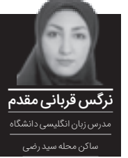
زنگس قربانی مقدم مدرس زبان انگلیسی دانشگاه ساکن محله سید رضی