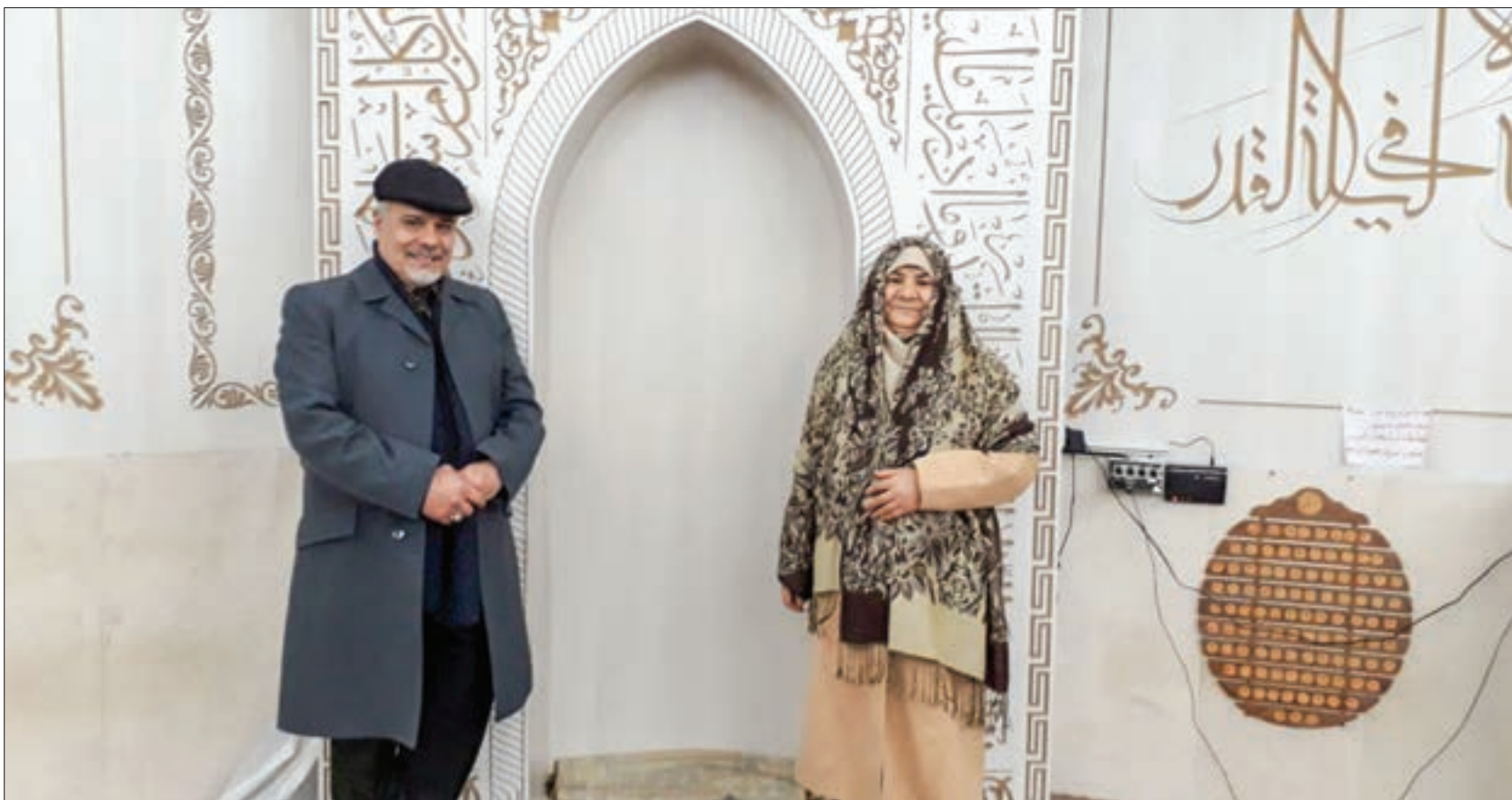
گفت و گوی شهرآرا با خادمان افتخاری نمازخانه پارک گل ها