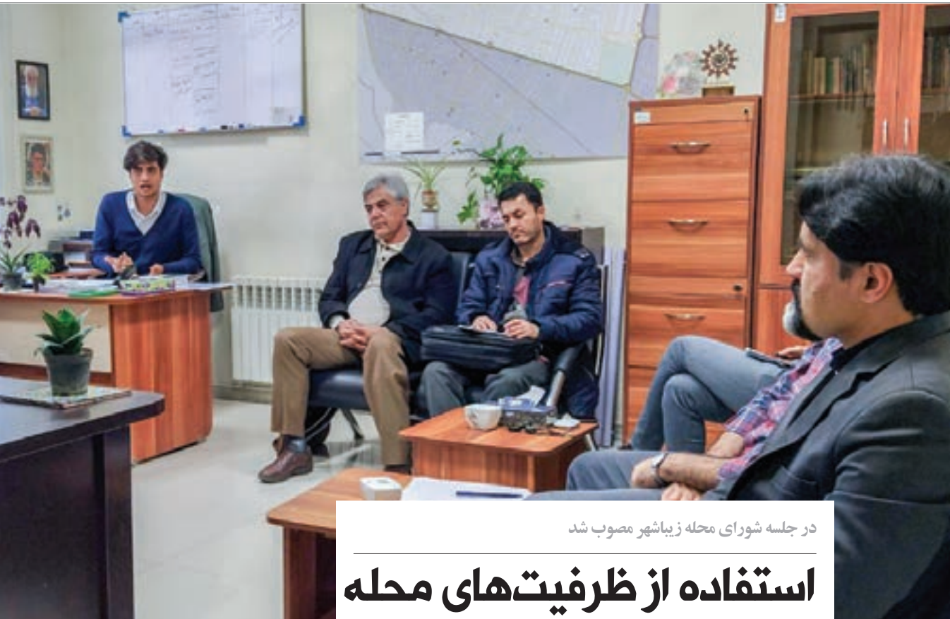
در جلسه شورای محله زیباشهر مصوب شد