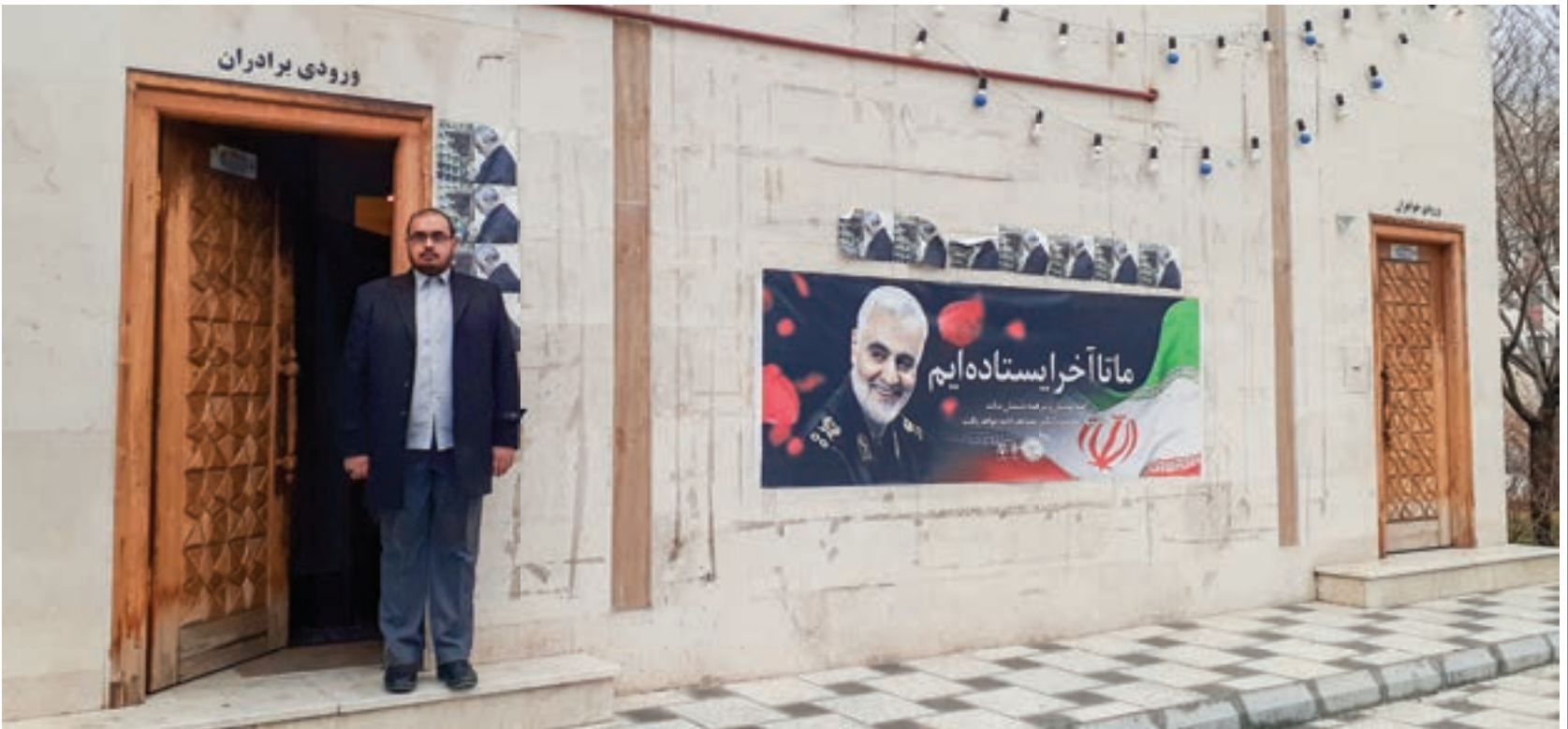
عضو شورای اجتماعی محله تأکید کرد: