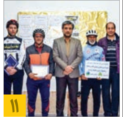
تقدیر شهردار منطقه از تیم دوچرخه سواری پاکران الهیه

شهردار منطقه ۱۲ به مناسبت روز هوای پاک از اعضای تیم دوچرخه سواری پاکران الهیه تقدیر کرد.