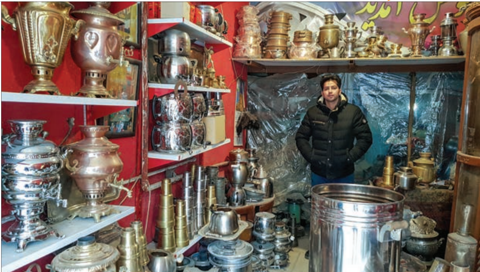
سماورساز محله حرعاملی از خدمتش به مردم می گوید