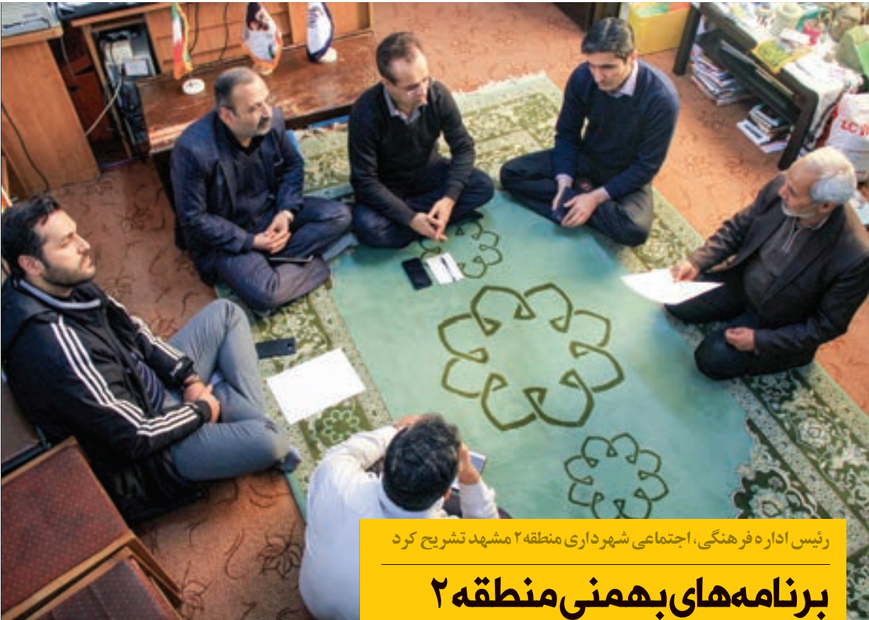
رئیس اداره فرهنگی، اجتماعی شهرداری منطقه ۲ مشهد تشریح کرد

نهمین نشست کمیته نظارتی شورای اسلامی شهر مشهد امسال برای حل مشکلات ساکنان منطقه ۲ در این منطقه مشهد برگزار شد. به گزارش روابط عمومی شهرداری منطقه ۲ مشهد، این نشست ها که با حضور اعضای کمیته نظارتی شورای شهر، رئیس کمیته نظارتی منطقه ۲، شهردار و