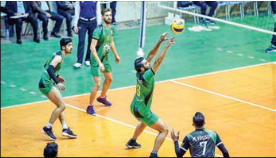
کسب حسن نیت در مشهد

تجربه حضور در فوتبال کشورها حوزه خلیج فارس را دارد، در گفت‌وگو با کادرفنی شهر خودرو اظهار کرد: تیم دوست‌داشتنی شهر خودرو علاوه بر ایران، نماینده مردم مشهد و خراسان است. وقتی الرفاع را بریدو نخستین پیروزی تاریخ فوتبال خراسان در آسیا را به ثبت رساندید، احساس غرور کردم. وی افزود: امیدوارم با همدلی و اتحاد این تیم بتواند در مصاف بعدی با السیلیه قطر نیز موفق باشد تا راهی مرحله گروهبی لیگ قهرمانان آسیا شود. مهاجرانی با تمجید از