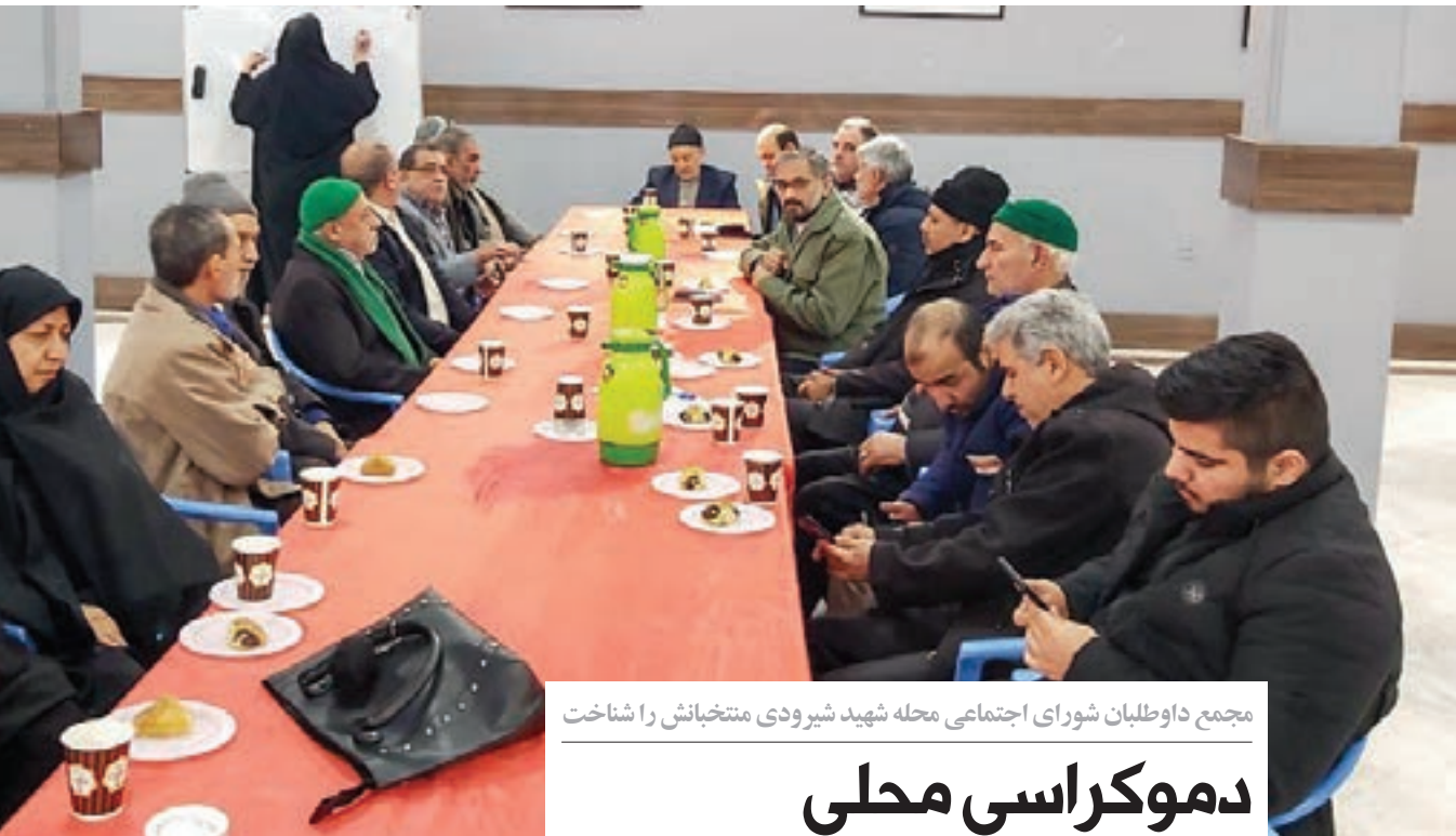
مجمع داوطلبان شورای اجتماعی محله شهید شیرودی منتخبانش را شناخت