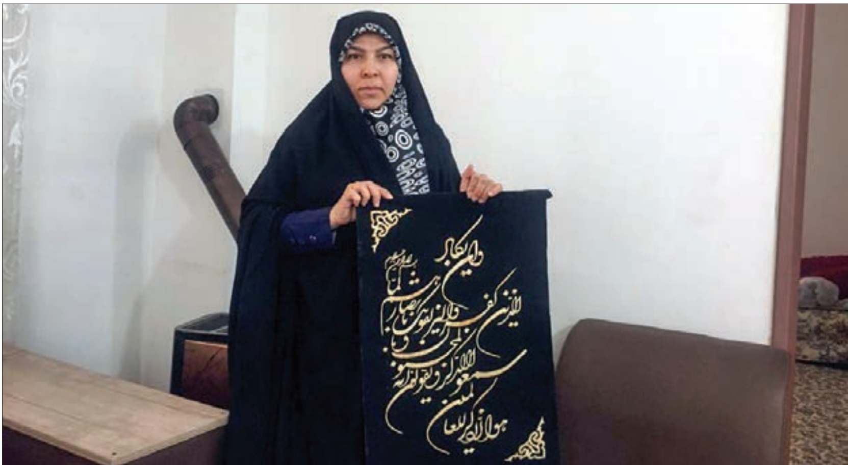
گفت‌وگو با یک شهروند فعال محله شهید رستمی که در هر کاری دستی دارد