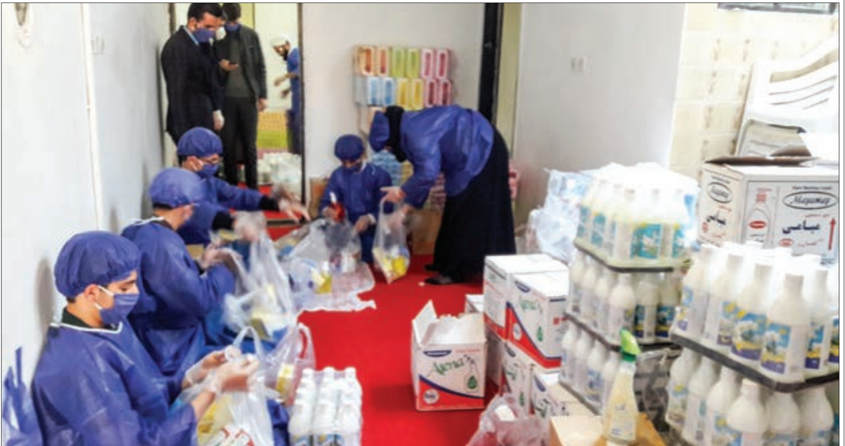
اقدام کمکی برای مقابله با کرونا بین ۵۰۰ خانواده نیازمند در شهرک طرق و سیدی توزیع شد