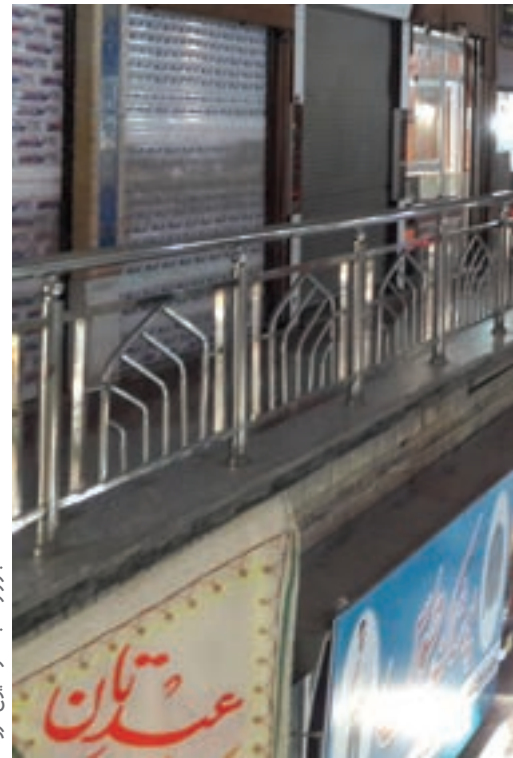
بازار رضا بعد از شیوع کرونا

ویژه معلولان در محل تقاطع کوشش، جمهوری اسلامی و خیابان ۱۷ شهریور اقدام کرد. مرادزاده افزود: طبق قوانین و مقررات راهنمایی و رانندگی تنها پلاک خودروهای توانیابان می توانند در محل های ویژه معلولان و جانبازان پارک کنند در غیر این صورت خودروهای عادی در صورت توقف با اعمال قانون مواجه خواهند شد.