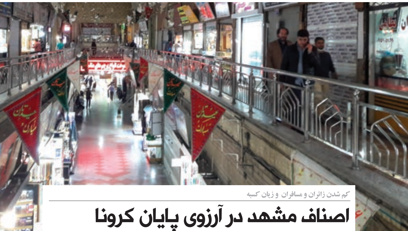
کم شدن زائران و مسافران و زیان کسبه