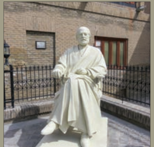
تندیس حاج حسین ملک