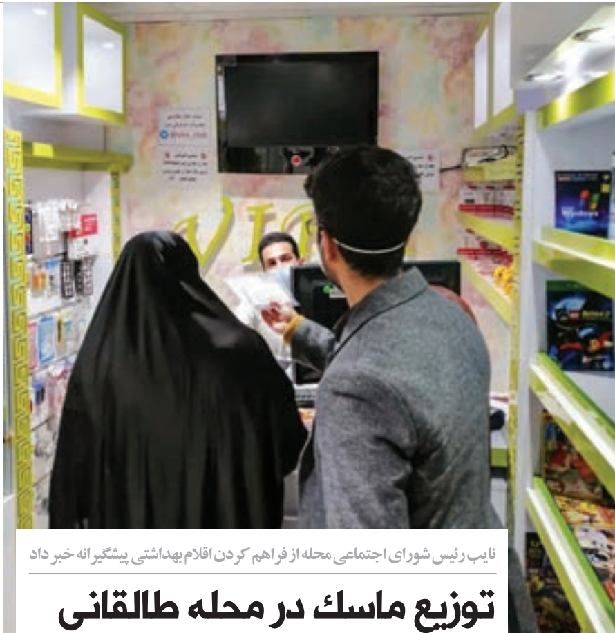
نایب رئیس شورای اجتماعی محله از فراهم کردن اقلام بهداشتی پیشگیرانه خبر داد

ویروس کرونا شوخی ندارد. اگر همسایه تان برای تهیه پول خرید نان مجبور باشد بیرون از خانه بماند شما هم در خطرید! اگر زیاده گرداها را تأمین نکنید کاختان مأمّن امنی برای حفاظت از این ویروس نخواهد بود. خلاصه کلام اگر آدم نباشید و دیگر اعضا را در نیابید، قرار برایتان نخواهد ماند. این ویروس آمده است تا انسانیت از یاد رفته را به ما یادآوری کند. تا بگوید ابر قدرت ها هم مانند صحرائشینان نیاز به ریه دارند تا تنفس کنند. من فکر می کنم تا زمانی که شاگردان خوبی نباشیم و بچه همسایه را مانند فرزند خودمان تأمین نکنیم محکومیم به حبس و قرنطینه. ■