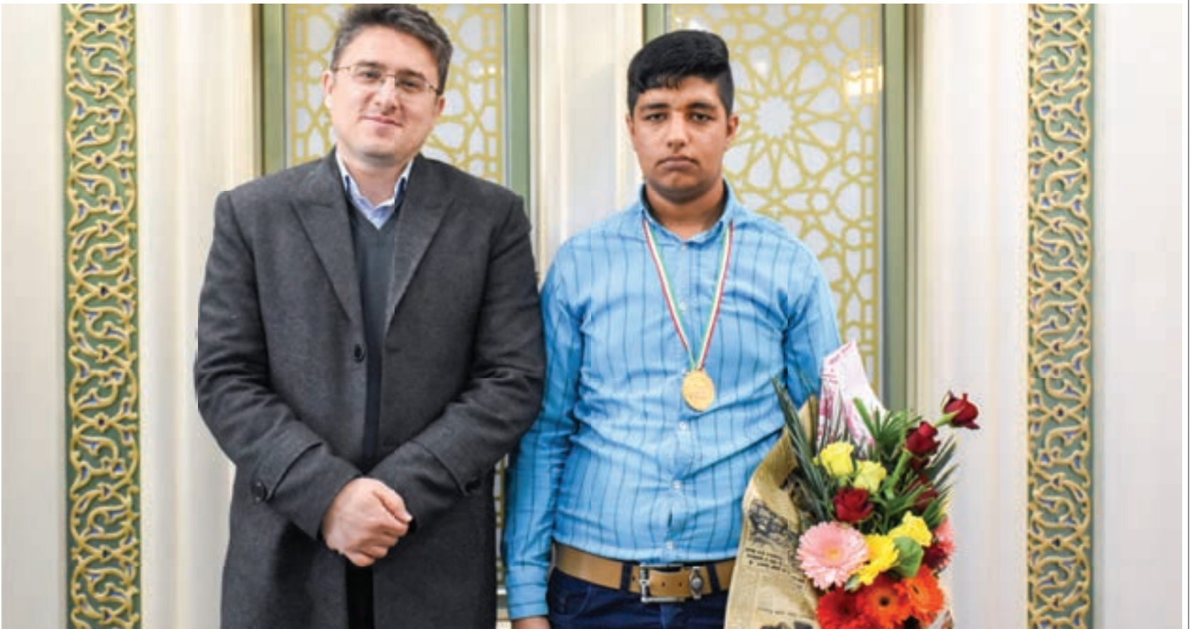
رتبه اول رشته ساختمان سازی المپیاد هنرستان های کار و دانش کشور تأکید کرد