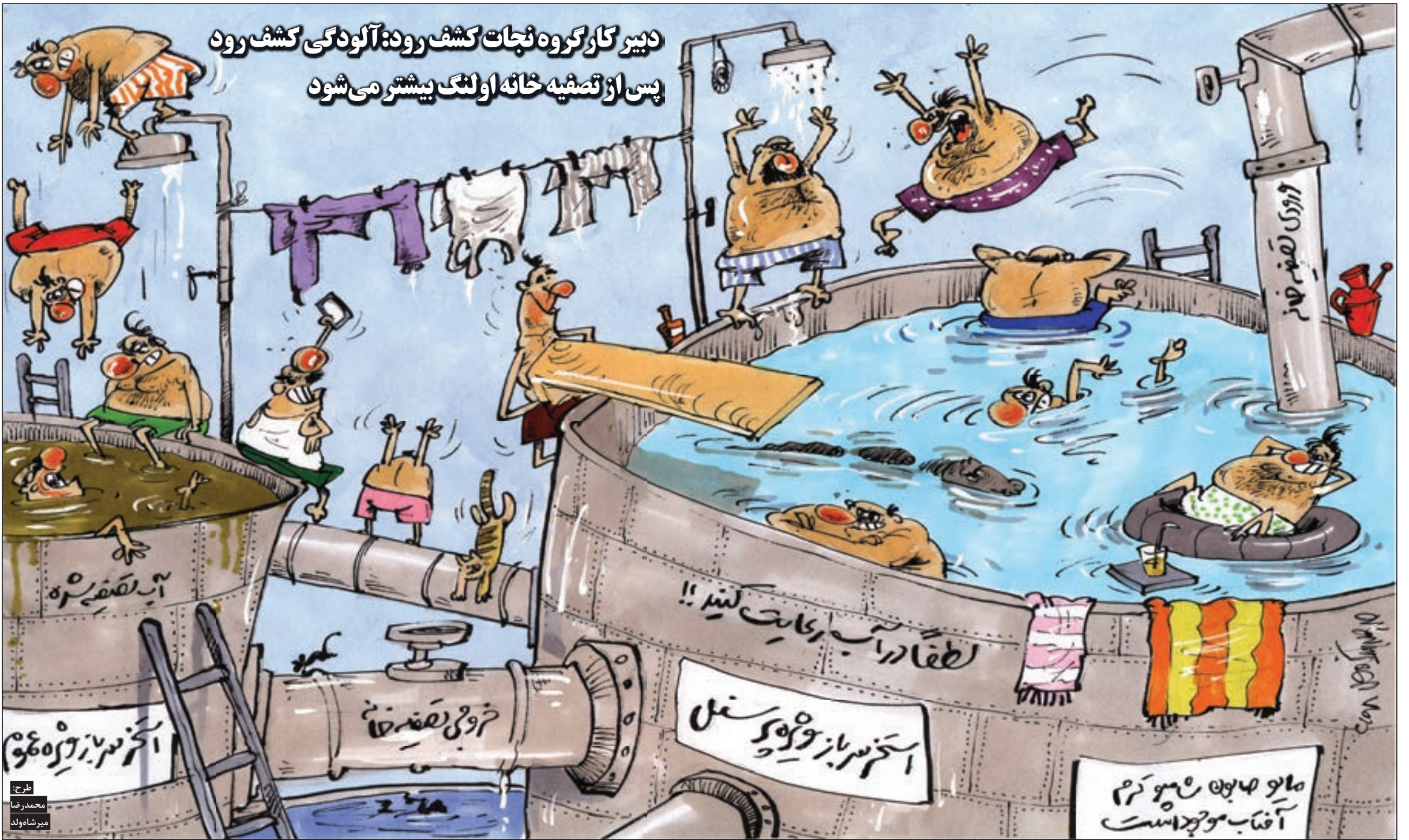
طرح: محمدرضا میرشاه‌ولد