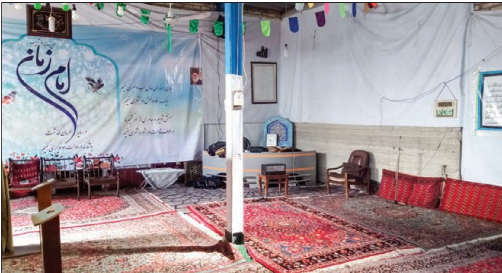
گزارش شهرآرمحله از مسجد شهرک ارمنان