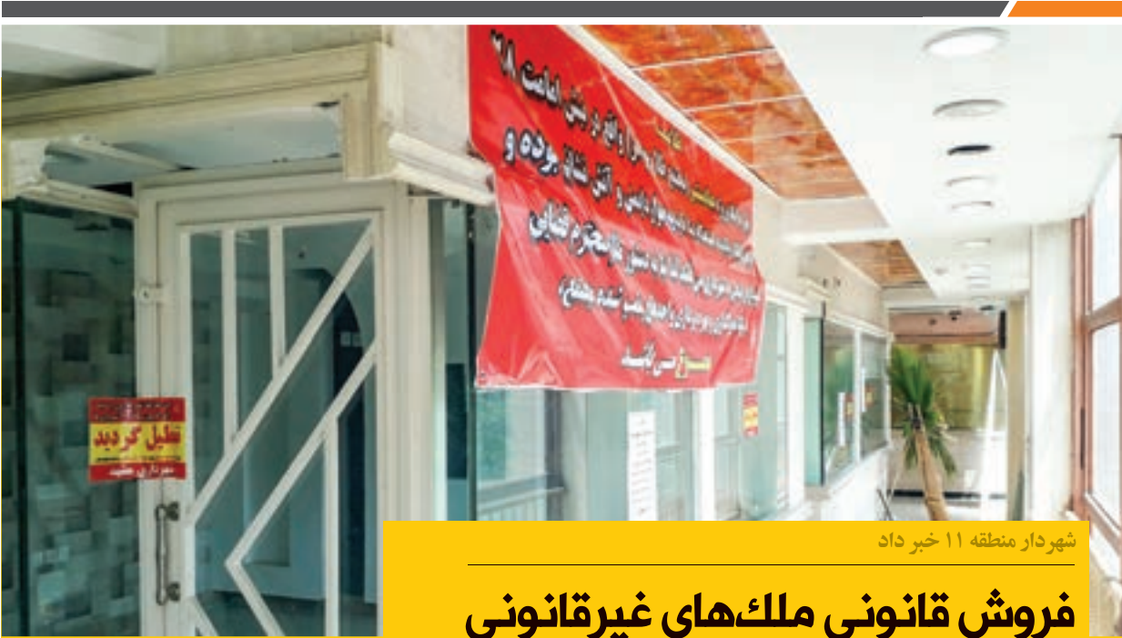
شهردار منطقه ۱۱ خبر داد

کتابگرد تا پایان تابستان در پارک ملت اجرا می‌شود و افراد می‌توانند هر هفته چهارشنبه‌ها از ساعت ۱۹ تا ۲۱ با مراجعه به مقابل دریاچه، کتاب‌هایی را که لازم ندارند اهدا کنند و هر کتابی را که مطالعه نکرده‌اند بدون پرداخت هیچ وجه یا ضمانتی بردارند.