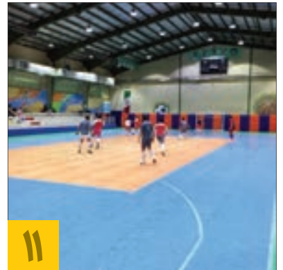
۱۱ دهمین المپیاد ورزشی محلات منطقه ۱۲