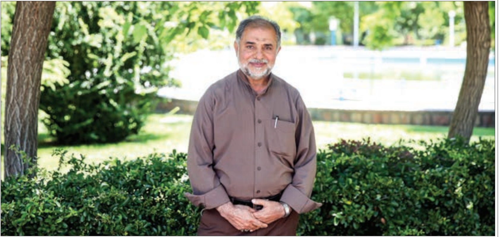
گفت‌وگو با مدیر خیریه محبان الائمه(ع) محله جاهدشهر