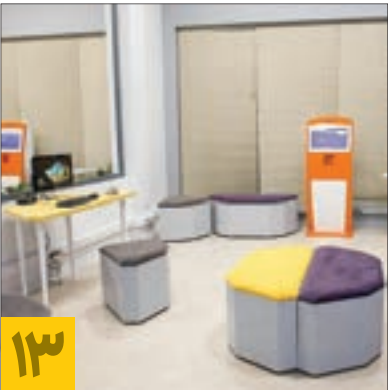
۱۳ درهای شهرداری بسته خواهد شد