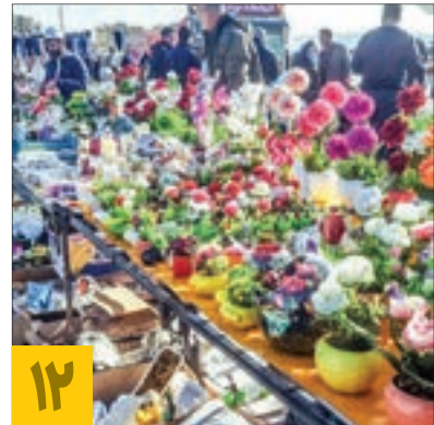
۱۲ راهاندازی چهارشنبه بازار گل و گیاه