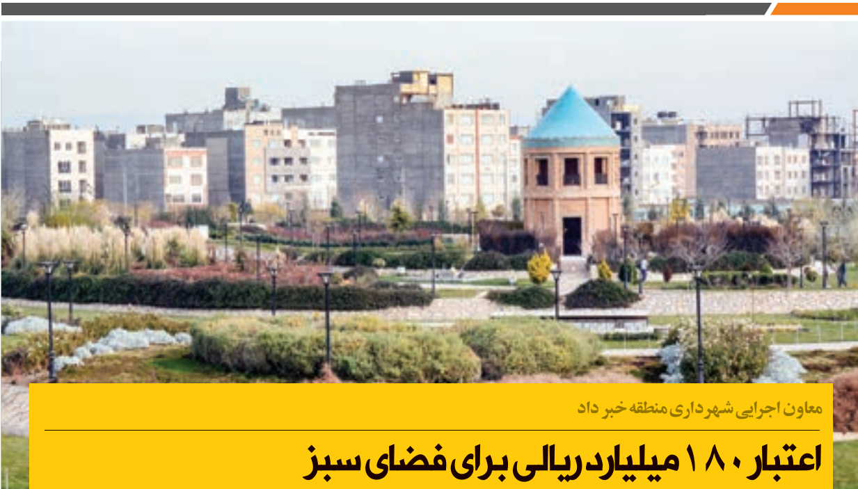
معاون اجرایی شهرداری منطقه خبر داد

در سالن های ورزشی آقا مصطفی خمینی، ثامن و مالک اشتر برگزار شد که تیم دانش آموزی منطقه تبادکان در دیدار نهایی تیم آموزشگاه شهید کاشانی تربت حیدریه را شکست داده و به مقام قهرمانی رسید. آموزشگاه آیت... خامنه ای سرخس به مقام سوم این مسابقات رسید و تیم دانش آموزی بردسکن برنده جام اخلاق شد.