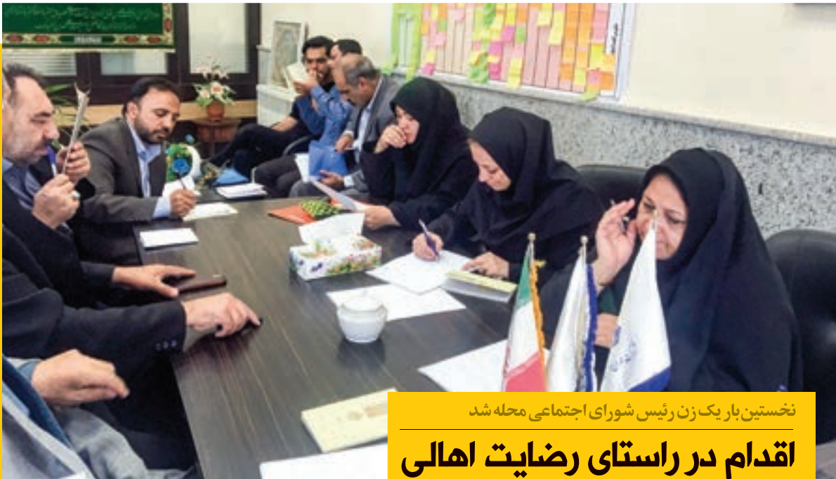
نخستین بار یک زن رئیس شورای اجتماعی محله شد

مقتضیان که در محدوده خیابان طبرسی، کاشانی، اندرگو، خز علی و بهجت هستند، می‌توانند با مراجعه به دفتر شهر آرامحله در خیابان دوازدهم کاشانی، دفتر معاونت فرهنگی و اجتماعی شهرداری منطقه ثامن در نواب صفوی ۱۱ یا اداره ناحیه یک شهرداری این منطقه در شیرازی ۵، نیش کوچه ضیاء، با ارائه مدارک ثبت نام کنند یا با شماره ۰۹۱۵۳۵۱۸۵ تماس بگیرند.