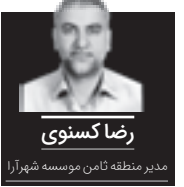
مدیر منطقه ۸۸ن موسسه شهرآرا

زادروز میلاد حضرت شمس‌الشموس (ع) بهانه‌ای است که نگاهی به ذخیره معنوی دین و ایمانمان در این سرزمین داشته باشیم و ماه ذیقعد را قدر