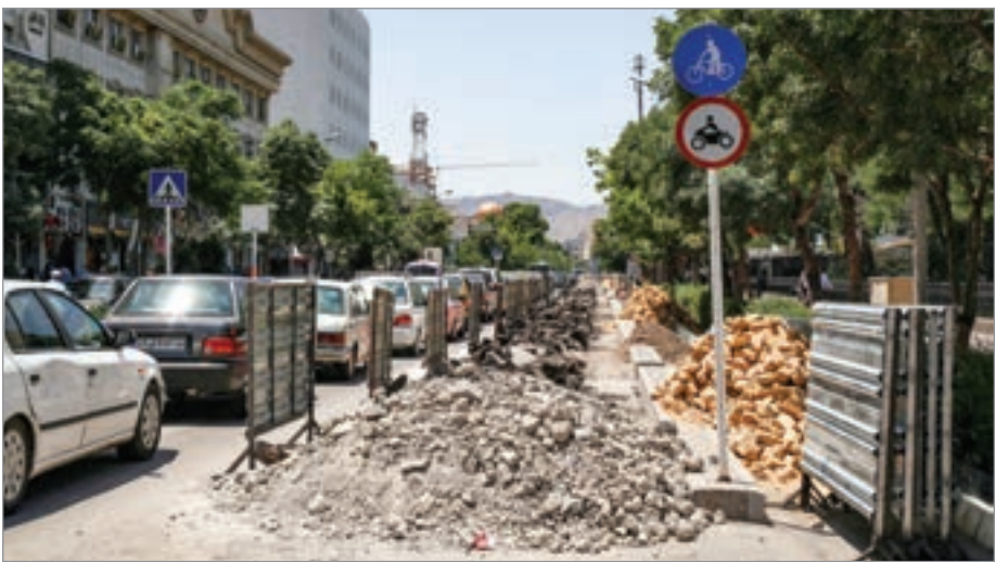
کند، پیمانکاران صفای خیابان

انتقاد اهالی و کسبه خیابان آیت... بهجت از ایجاد مسیر دوچرخه در این خیابان