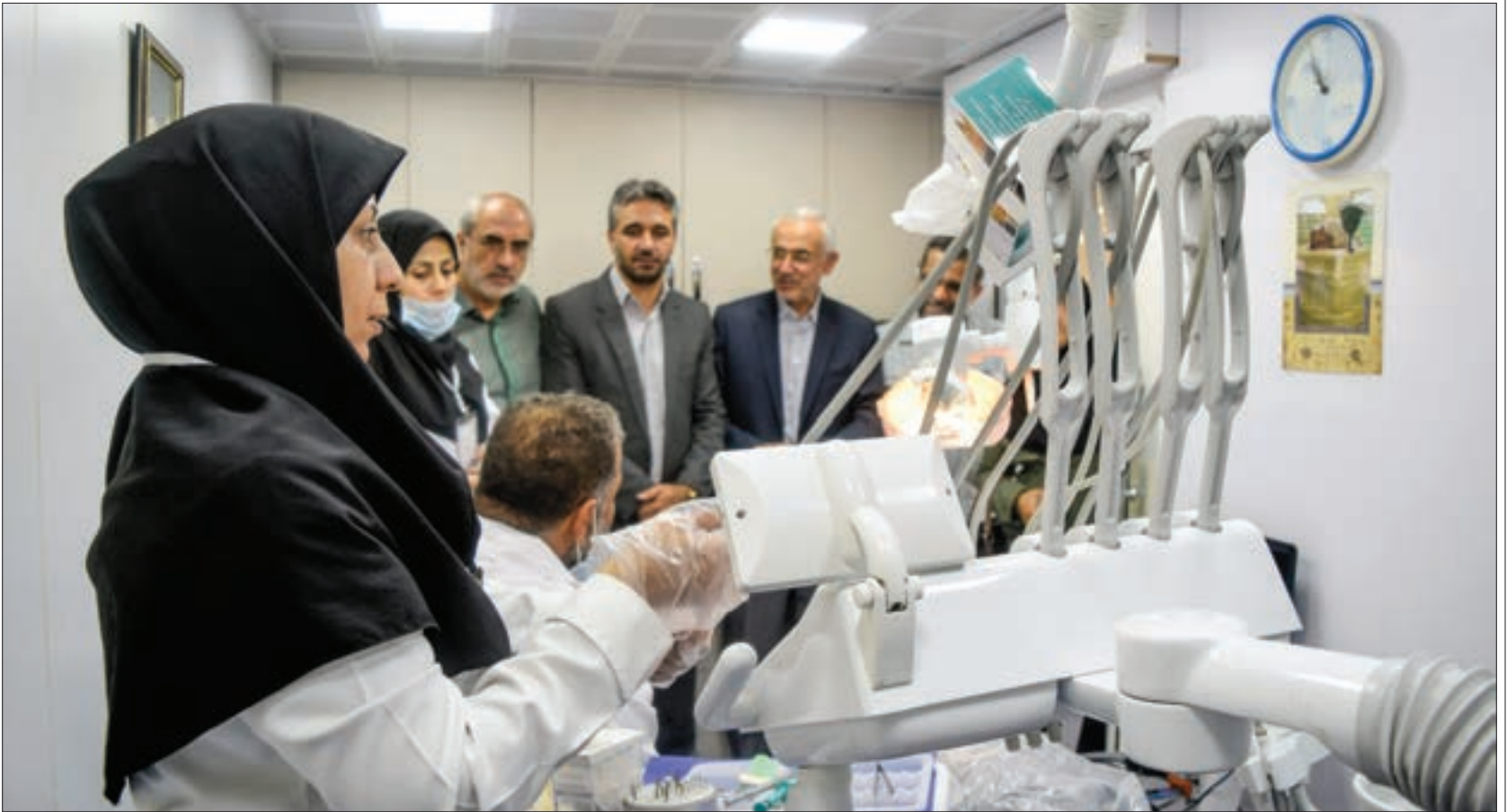
گزارش شهرآرامحله از مجتمع بهزیستی پالیزکاران که ۲درمانگاه سیار مجهز در آن مستقر شده است