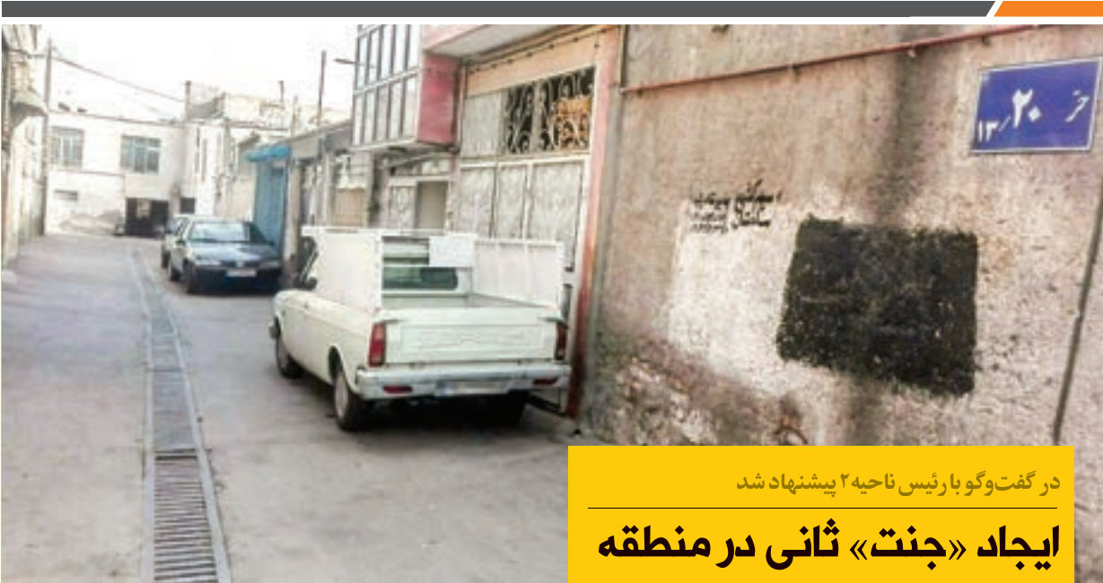
در گفت‌وگو با رئیس ناحیه ۲ پیشنهاد شد

که از سوی اهالی مورد پرسش قرار گرفت، گفت: مسئله اتصال مهریز ۳۲ به امیرآباد ۳۸ هم در محدوده زمین‌های آستان قدس است. مسئله دیگری که حیدری به میان آورد، موضوع نبود دسترسی عمومی بین شهرک‌های شیرین و شهید رجایی است. وی در این باره گفت: طرح زیرگذر ارتباط بین این دو شهرک فقط از طریق پل زیرگذر عابر پیاده است. کمی جلوتر از این پل هم زیرگذر باریکی است که فقط یک خودرو سواری از آن می‌تواند تردد کند. در واقع همین مسیر باریک را اداره راه‌آهن ایجاد کرده است چون روی آن مسیر ریلی است و این محدوده در اختیار راه‌آهن است. موضوع دیگری که شهردار منطقه از آن گفت قطعه‌های چمن کاری شده‌ای بود که با بلوکه‌های بتنی محصور شده است؛ ما چمن روی آن احداث کردیم اما مالکیت آن مربوط به آستان قدس است. آستان قدس بلوکه‌ها را گذاشته است که مالکیت خود را تثبیت کند. مکاتبه هم داشتیم و پیشنهادهایی دادیم. گفتیم زمینی را در منطقه به ما پیشنهاد بدهید که در اختیار ما باشد تا آن را برای مردم به فضای سبز تبدیل کنیم. وی پیشنهاد داد: اگر آستان قدس قبول کند که به جای بلوکه‌های بتنی جای جای منطقه از نرده استفاده کند، دیگر کارتن خواب پشت این نرده نمی‌آید یا از تعدادشان کاسته می‌شود. ■