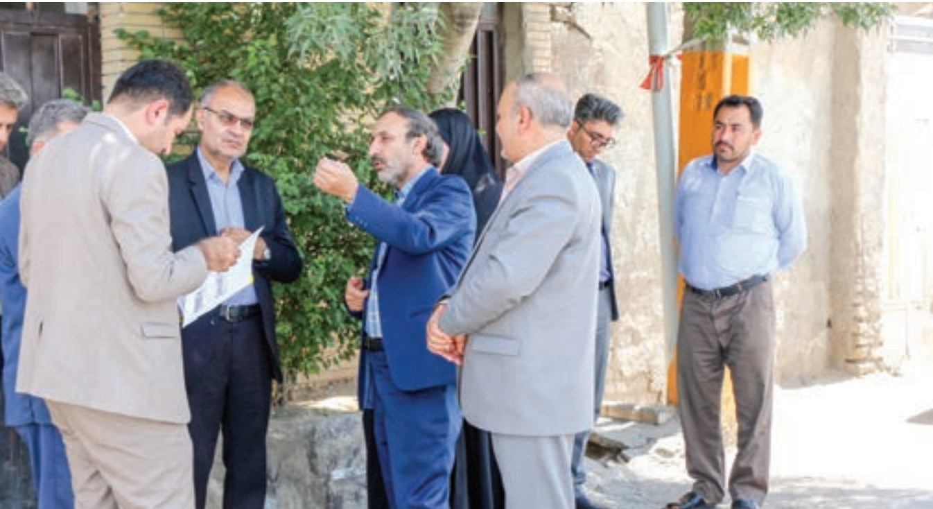
نایب رئیس شورای اسلامی شهر مشهد در جریان بازدید از شهرک شهید رجایی:

با این اوصاف، برای پیشگیری از تضییع حقوق موجر و مستأجر و نیز جلوگیری از سرگردانی آن ها در راهروهای دادگستری، عاقلانه است که در تنظیم اجاره نامه علاوه بر آموزش قوانین مالک و مستأجر از نظر و کمک وکیل یا مشاور حقوقی حتماً استفاده شود. در ضمن توصیه می کنم همواره قراردادهای اجاره خود را با امضای دو نفر شاهد تنظیم کنید. ■