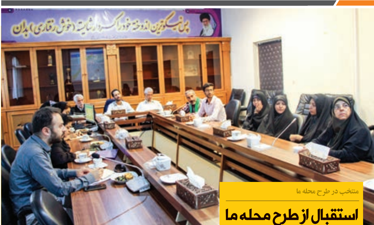
منتخب در طرح محله ما

بحران با حضور اعضای گروه های دوام ثامن انجام شد. هدف از سامان دهی پاتوق های محله، تلاش برای قوی شدن تعاملات اجتماعی، آگاهی شهروندان از وقایع روز از جمله سیل و ارتقای کیفیت و محیط شهری است تا سراسر زندگی حس تعلق به محله و امنیت اجتماعی محلات شهرمان تقویت شود.