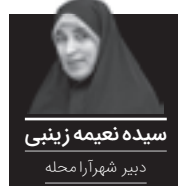
سیده زینب دایر شهرآرا محله

ما عادت کرده ایم به این همسایگی. به این بودن. به این مجاورت ناخودآگاه. به این در معرض بودن مداوم. هر وقت که دلمان تنگ شده دعوتش از پیش برایمان فرستاده شده