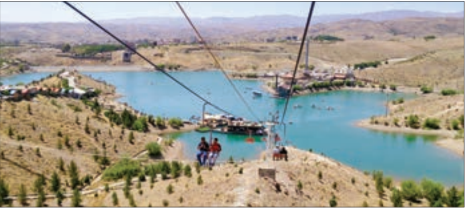
کف ترابری است

ممکن است در گذر ۲۰سال دیگر تغییر کند؛ چون وسایل تفریحی هر چند سال تغییر می‌کنند؛ بی‌شک بهترین دوره کوتاه‌تر شود. نکته دیگر تغییر مالکیت در دوره‌های طولانی است. این تغییر مالکیت‌ها نیز با ادعاها و بر خودهای بعدی همراه است. نکته آخر آنکه جو عمومی برای واگذاری شهر به مدت طولانی، مناسب نیست؛ چون گفته می‌شود شهر را حتی تا چند دوره بعد واگذار کرده‌اند.