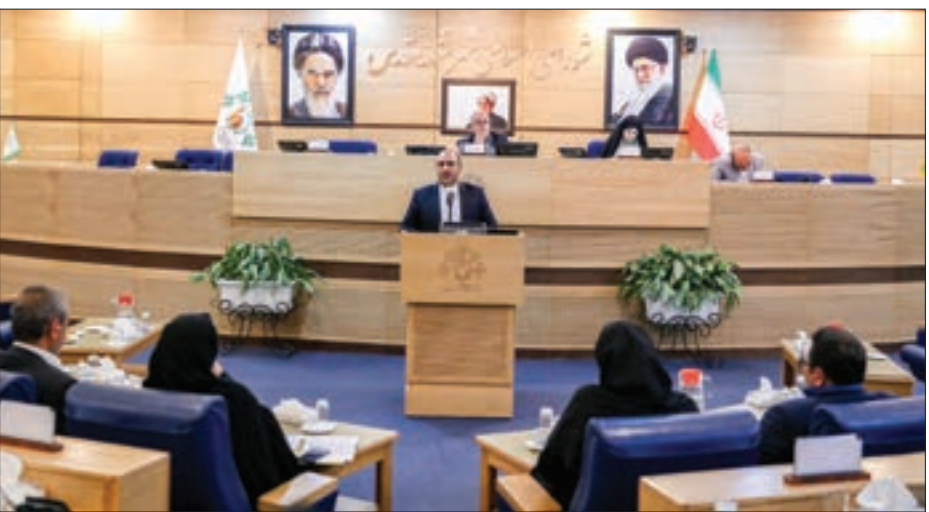
علنی صحن مشهد شورا