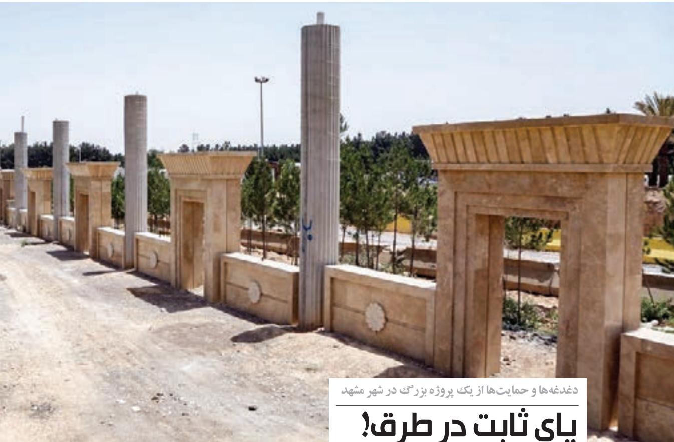
دغدغه ها و حمایت ها از یک پروژه بزرگ در شهر مشهد

ما هم به این بودن هایی که لطافت حضور مخاطبان را به جانمان تزریق می کند، دلخوشیم و می خواهیم که هر چه بیشتر بتوانیم در کنار فعالیت های محله باشیم. گلايه ای که شاید بعضی محلات از ما دارند و بعضی در نشست مطرح کردند، این بود که چرا از محله شان کم می گوئیم یا فعالیت های مسجد و نهاد های فرهنگی محل سکونتشان را پوشش نمی دهیم؟ اما آنچه شاید دوستانمان ندانند، این است که برای تعداد معدود خبرنگارانی که در محله هستند، شاید مقدور نباشد که بتوانند لحظه به لحظه از اخبار محلات مختلف کسب اطلاع کنند. پوشش اخبار ۱۸ محله در منطقه ۷ که در دل هرکدامشان مساجد و مراکز فرهنگی فعال حضور دارند، نیاز به همیاری و همراهی کسانی دارد که ما را از خودشان می دانند و می خواهند فعالیت های محلی هایشان دیده شود. چه اتفاقی بهتر از این که مخاطبان ما خودشان به ما بگویند چه درخواستی دارند؟ مشتاق شنیدن این درخواست ها هستیم تا باز هم شما را کنار خودمان ببینیم. ■