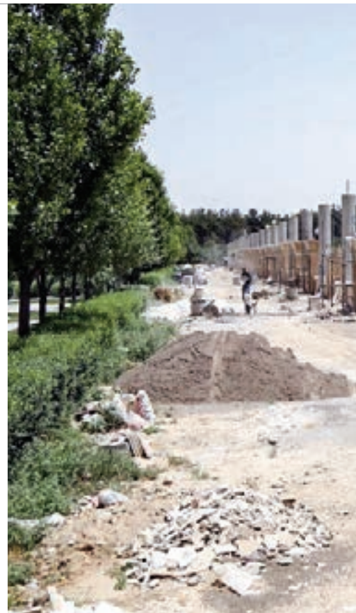
خواسته اهالی طرق از آقای ثابت این است که نام این پارک را تغییر ندهند و نام طرق کماکان روی این مجموعه باقی بماند.

اسلامی، نیش چهارراه پروین اعتصامی می باشد. علاقه مندان به شرکت در این مسابقات به صورت انفرادی و یاتیمی با همراه داشتن ۲ قطعه عکس و کپی کارت ملی می توانند بدون پرداخت هرگونه هزینه در این رقابت ها که در سالن های ورزشی شهید نامی، شهدای گوهرشاد و مجموعه ورزشی ثامن الائمه طرق برگزار می شود، شرکت کنند.