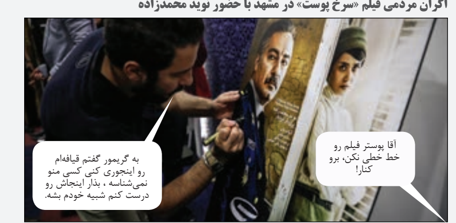
اکران مودمی فیلم «سرخ پوست» در مشهد با حضور نوید محمدزاده

اصفهان رو که دیدیم، این شله مشهدی رو کجا می‌دن؟ از اونجا می‌اندازی تو جاده مشهد و می‌ری، فقط سطل یادت نره ببری.