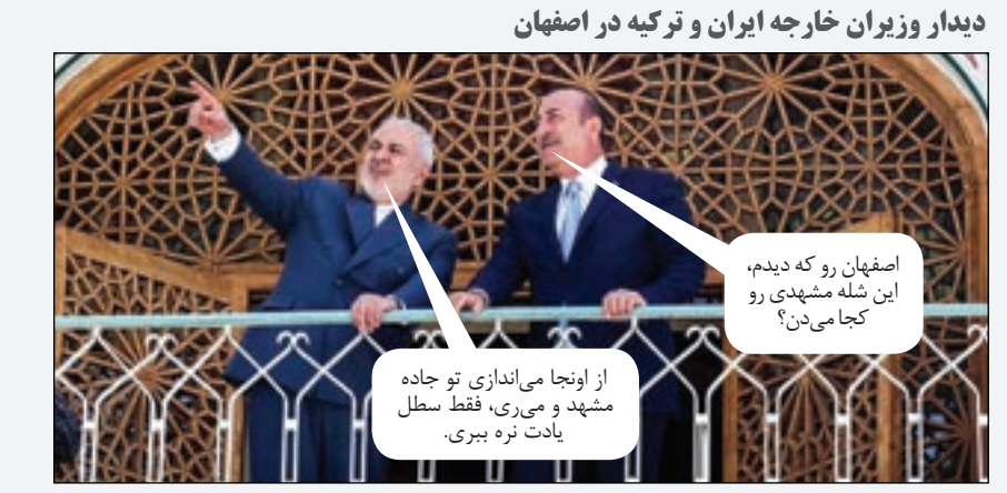
دیدار وزیران خارجه ایران و ترکیه در اصفهان

اصفهان رو که دیدیم، این شله مشهدی رو کجا می‌دن؟ از اونجا می‌اندازی تو جاده مشهد و می‌ری، فقط سطل یادت نره ببری.