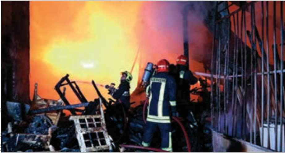
تیم‌های اطفای حریق

آتش‌سوزی میدان توحید از ساعت ۲۳:۳۰ یکشنبه آغاز شده بود و عملیات خاموش کردن آتش با توجه به حجم گسترده آن تا ظهر دیروز ادامه