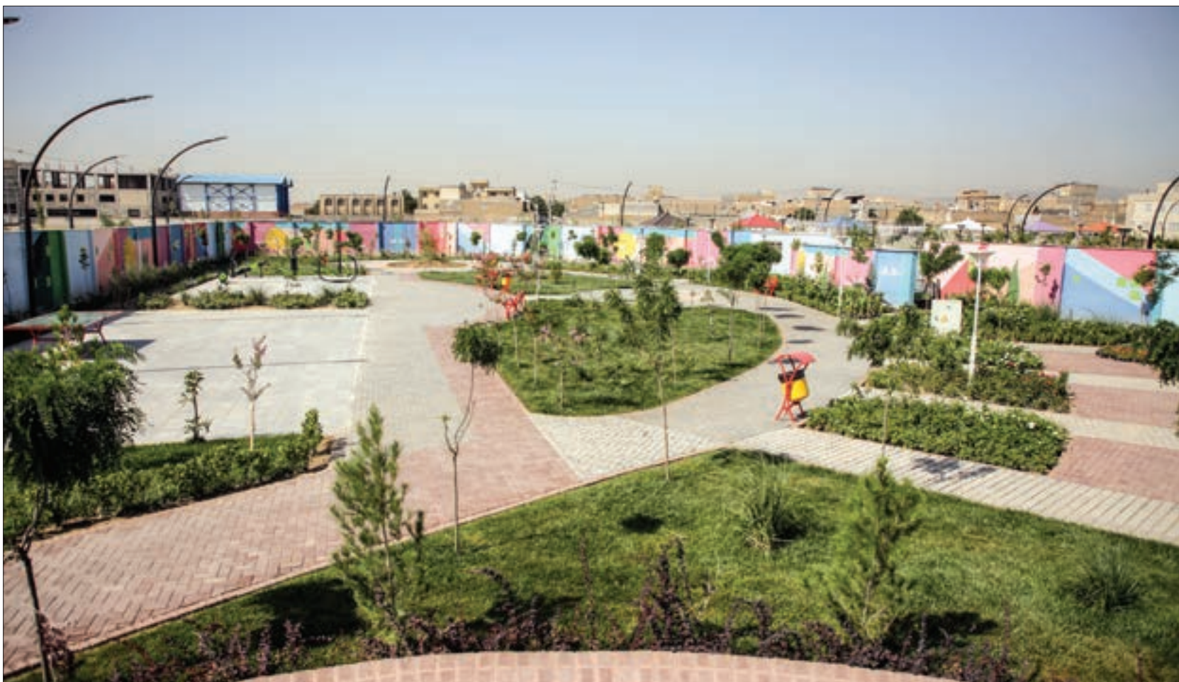
گشت‌وگذاری در سایت ورزشی نوپای بانوان امید محله انصار