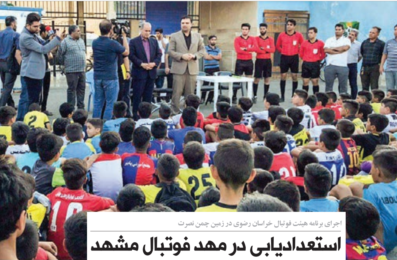
اجرای برنامه هیئت فوتبال خراسان رضوی در زمین چمن نصرت