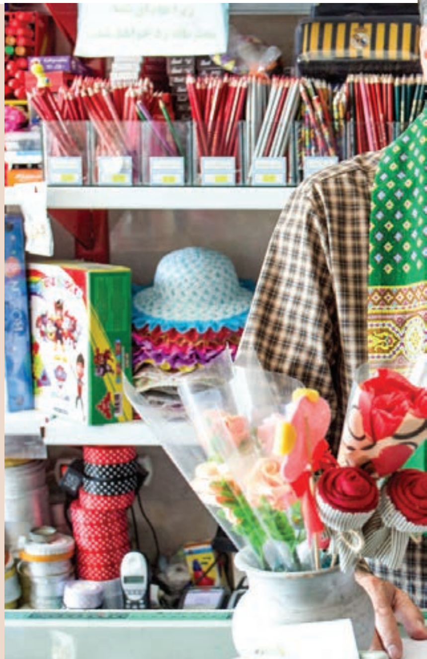
کنان شهرک شهید باهنر را دارد