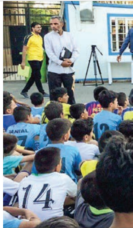
بلندمدت برای پرورش و حفظ این استعدادها داریم.