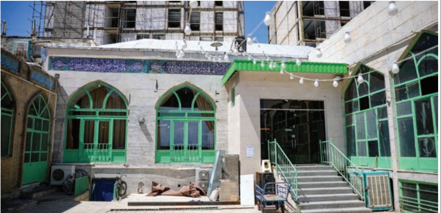
به توصیه محراب‌خان بعد از فوتش بیشتر اموال او وقف شد