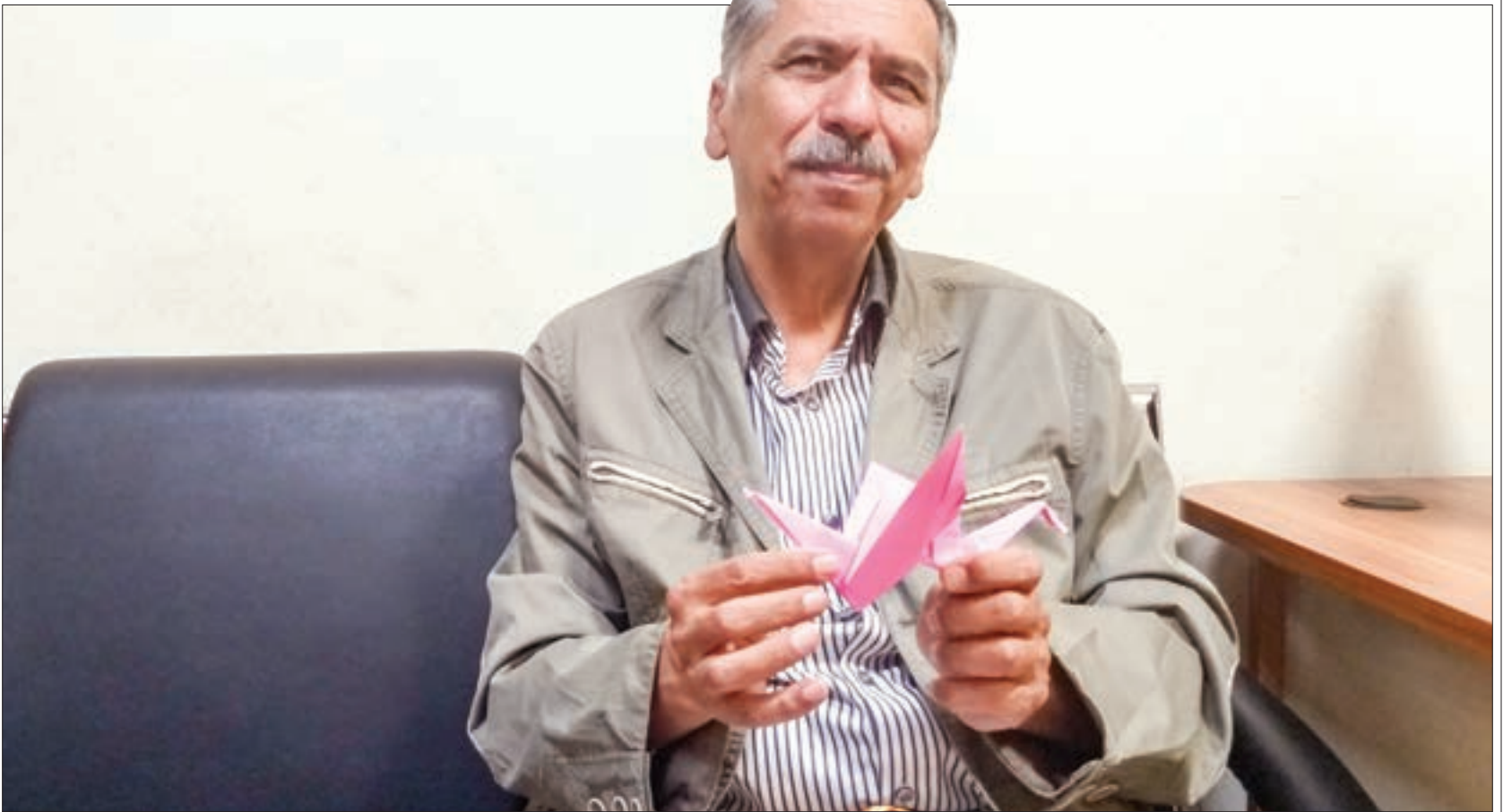
گفت‌وگو با هنرمند اورینگامی منطقه