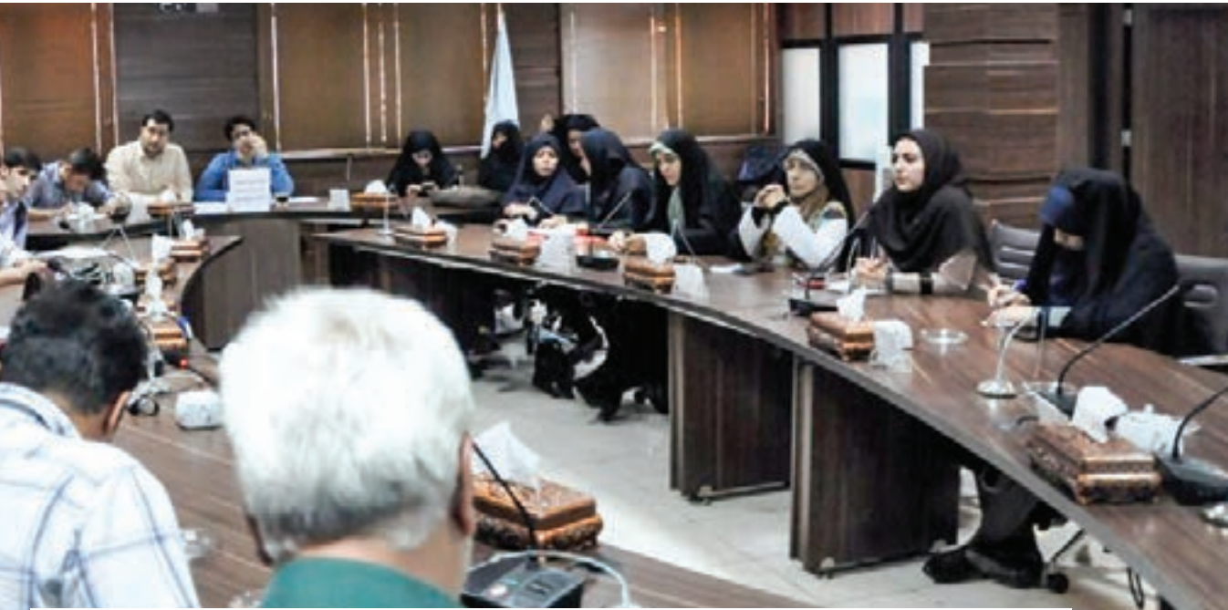
اولین جلسه شورای محله شریف برگزار شد