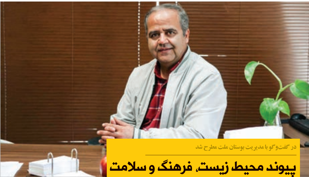
در گفت‌وگو با مدیریت بوستان ملت مطرح شد