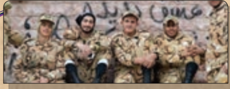
بیا خانم تلخ

پیام های خود را از طریق پیامک و ۳۰۰۷۲۸۹ @shahrara.metro شبکه های اجتماعی برای ما ارسال کنید