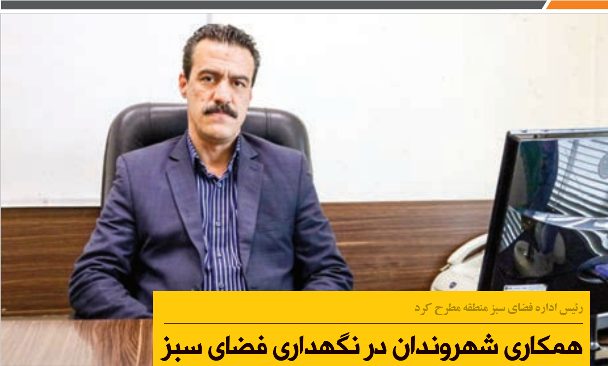
رئیس اداره فضای سبز منطقه مطرح کرد