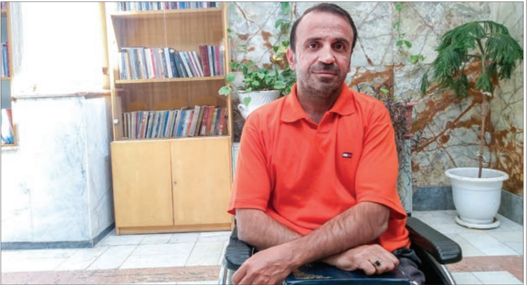
گفت و گوی شهرآرا محله با جانباز امنیت