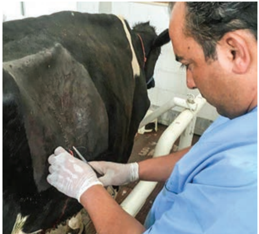
مسئول قدیمی ترین در مانگاه دام پزشکی بولوار شاهنامه عنوان کرد: