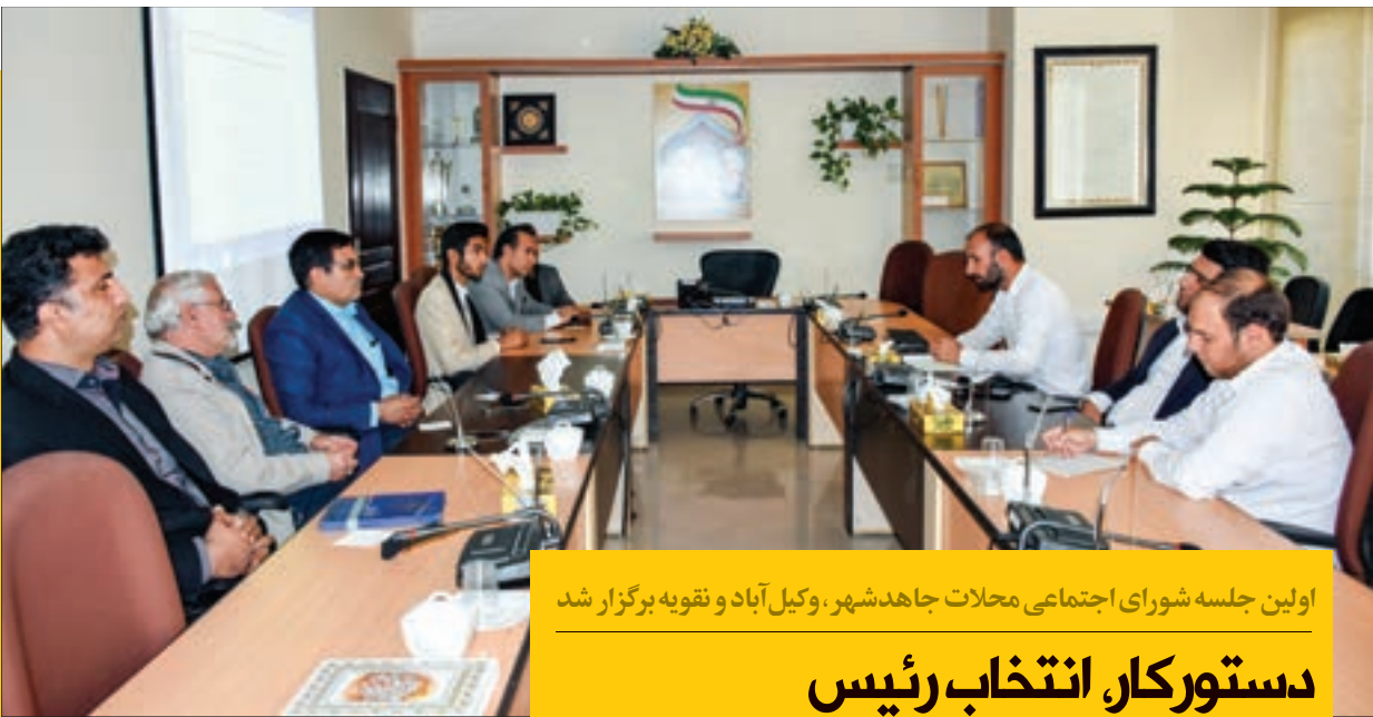
اولین جلسه شورای اجتماعی محلات جاهدشهر، وکیل آباد و نقویه برگزار شد

دکتر تمیزی، یک آموزشگاه ۲ کلاسه در روستای فیض آباد افتتاح شد و همچنین کلنگ یک آموزشگاه ۴ کلاسه در روستای شهرآباد بر زمین خورد. وی افزود: تمامی این پروژه‌ها به همت خیران و با مشارکت با اداره کل نوسازی و تجهیز مدارس صورت گرفته است.