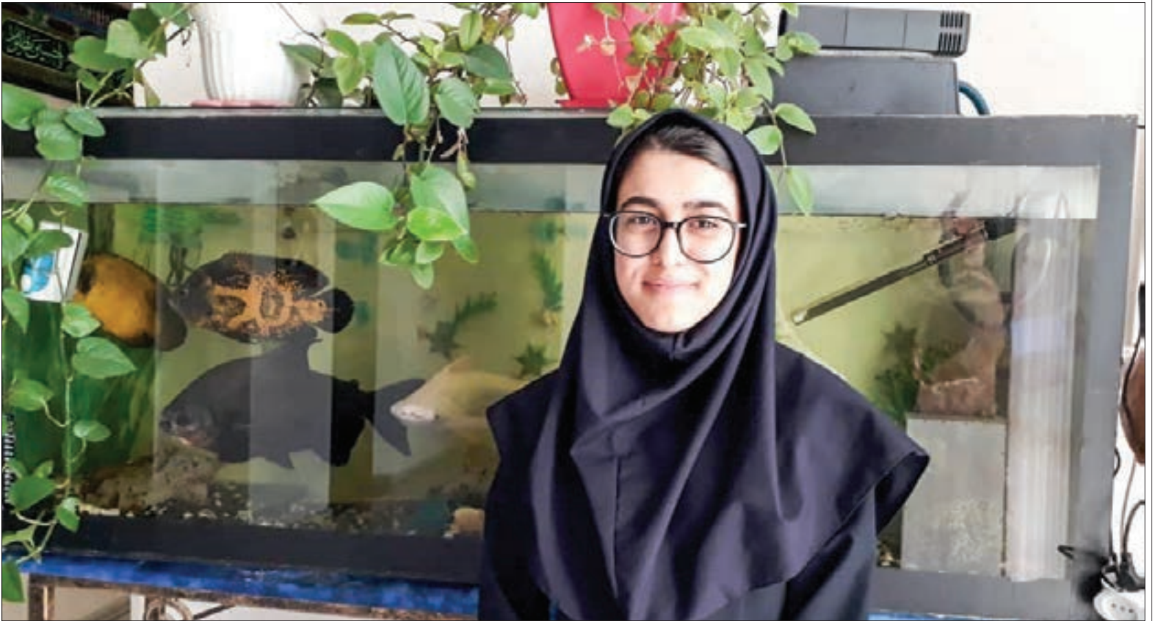
دارنده مدال نقره المپیاد جغرافیا در گفت و گو شهر آرمحله: