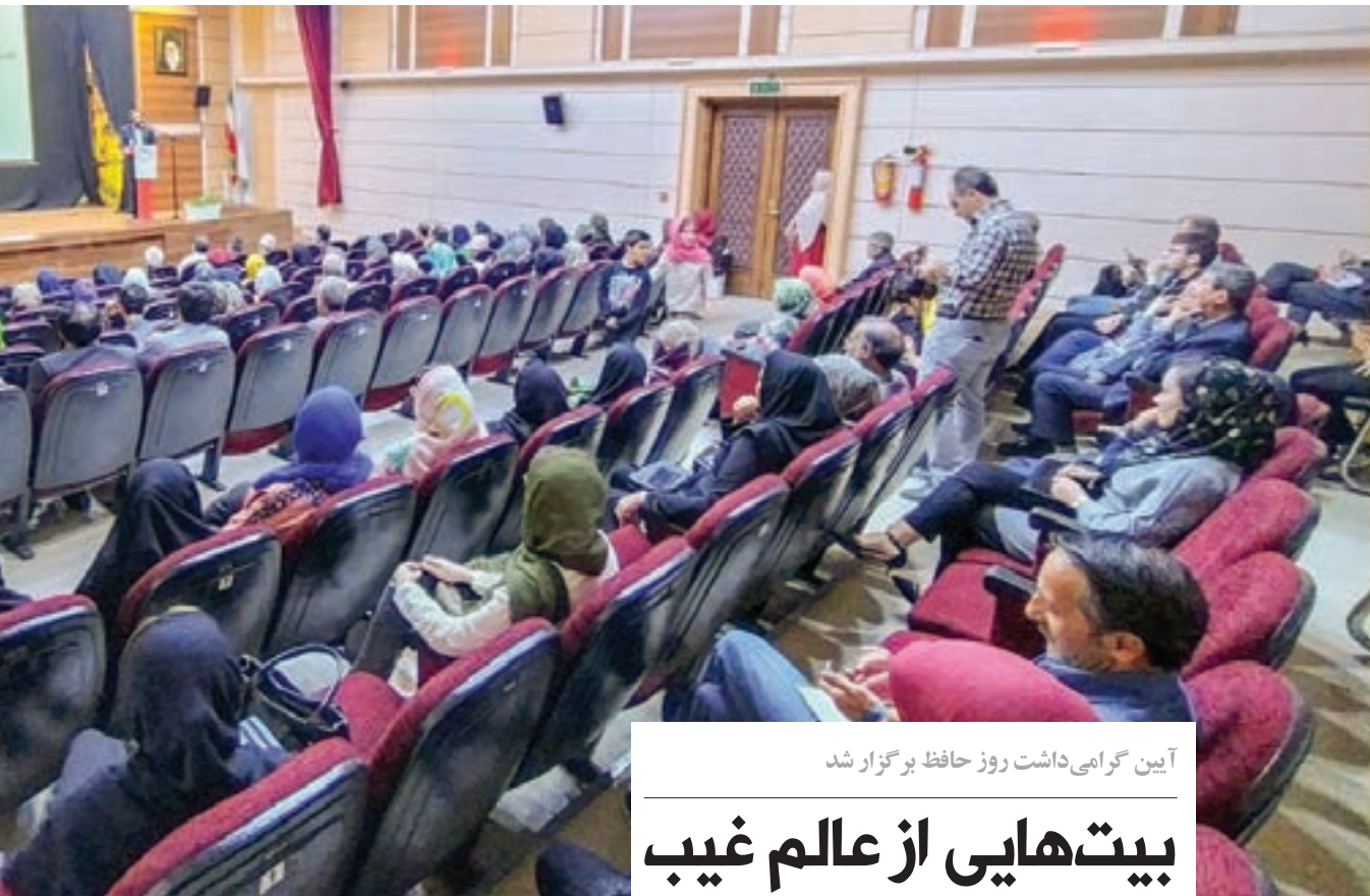
آیین گرامی داشت روز حافظ برگزار شد