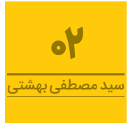
سید مصطفی بهشتی

در ابتدای این مراسم امین الهامی، کارشناس ادبیات، ضمن اشاره به تنوع در شعر حافظ بیان کرد: حافظ همه چیزهایی که باید یک شاعر داشته باشد، دارد. شعر حافظ را می‌شود قشنگ خواند. شعر حافظ جلوه‌ای دارد که خیلی از استادان و معلمان ادبیات با آن ارتباط برقرار می‌کنند و در واقع حال می‌کنند. در شعر حافظ، شما تاریخ را می‌بینید. وی افزود: به لحاظ اجتماعی اگر بخواهید به شعر حافظ نگاه کنید، روایتی از یک سرخوردگی اجتماعی را در آن دوران می‌بینید