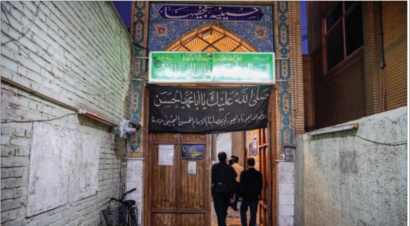
۴۸ سال از آمدن نجفی‌ها از عراق به مشهد می‌گذرد