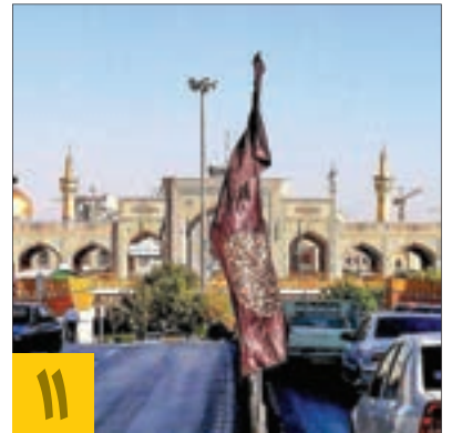
۱۱ جاگذاری ۲۵ دستگاه عطریاش در معابر اطراف حرم

برای اولین بار در مشهد، شهرداری منطقه ثامن ۲۵ دستگاه عطریاش الکتریکی خودکار در معابر اطراف حرم مطهر رضوی نصب کرد که بخش کننده عطر حرم است.