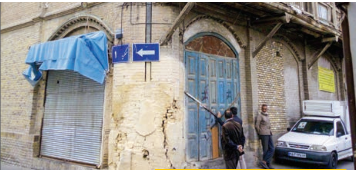
به دلیل در اختیار نگذاشتن مغازه ها، عملیات عمرانی اجرا نشده است

هزار خادم افتخاری حرم مطهر رضوی برای خدمت رسانی به زائران اربعین حسینی در مرز مهران و شهرهای زیارتی عراق خدمت رسانی را شروع کرده اند. به گزارش شهر آرامحله، آن طور که آستان قدس رضوی اعلام کرده است، موکب های این نهاد در مرز مهران تاکنون روزانه ۱۰۰ هزار پرس غذا، آب معدنی و همچنین خدمات مختلفی