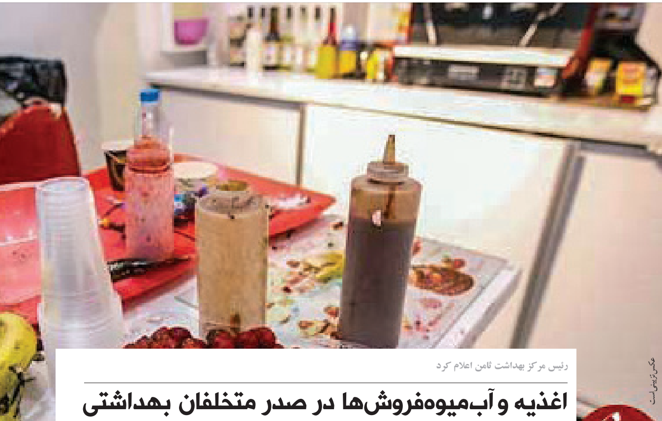
رئیس مرکز بهداشت ثامن اعلام کرد