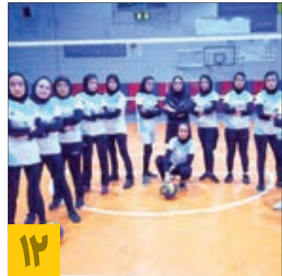
۱۲ شرکت ۵ هزار و ۵۰۰ نفر در مسابقات ورزشی

به گزارش شهرآرامحله، این دستگاه‌ها در خیابان‌های نواب صفوی و شیرازی نصب شده و در روزهای پیک زائر روشن می‌شود. عید نوروز، دهه کرامت، دهه اول محرم و دهه آخر صفر از جمله ایامی است که دستگاه‌های عطریاش روشن می‌شوند. این دستگاه‌ها خودکار بوده و شهرداری منطقه ثامن عطر آن‌ها را تأمین می‌کند. این طرح به نوعی الگو برداری از دستگاه پخش عطر در حرم مطهر رضوی است. علاوه بر این در الگو برداری از حرم مطهر دستگاه‌های آب سردکن منطقه ثامن هم در حال تبدیل شدن به دستگاه سنگی مشابه داخل حرم است. تاکنون بسیاری از ۷۵ آب سردکن این منطقه سنگی شده و تعداد باقی مانده با جنس استیل نیز در آینده نزدیک تبدیل خواهد شد. منطقه ثامن بیشترین تعداد آب سردکن را دارد که ۳۲۰ شیر برداشت آب را در اختیار زائران و مجاوران قرار می‌دهد. آب سردکن‌هایی که به طور مداوم شست و شو و تعمیر می‌شوند. این تعداد آب سردکن جدا از آب سردکن و شیرهای آبی است که مغازه‌دارها و مساجد برای نوشیدن آب در اختیار مردم گذاشته‌اند.