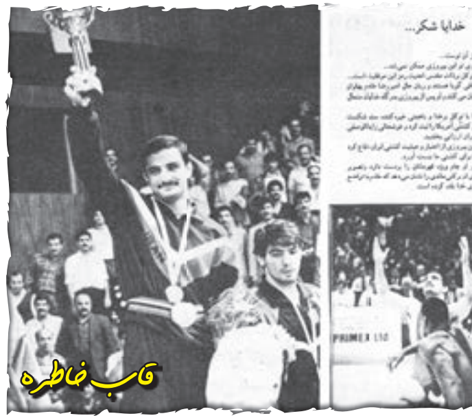
کتابت: محسن بخشنده

تزییق پول از هر تاکتیکی برای ما لازم تر است چیزی که تیم ما را اذیت می‌کند و امیدوارم مسئولان با حمایت بموقع به دادمان برسند، این است که باید هر