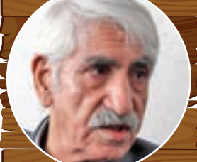
ساروز تولد علی محمدیان پدر هندبال خراسان و بنیان‌گذار ورزش هاکی در مشهد