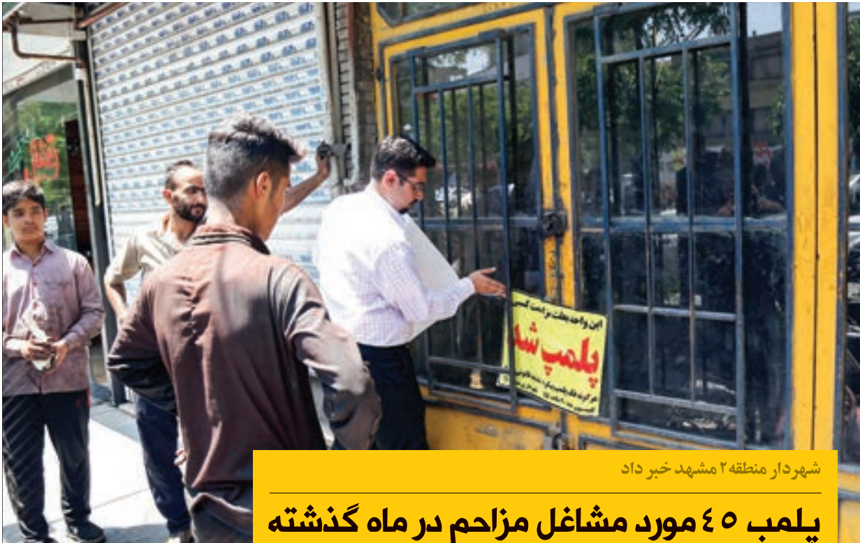
شهردار منطقه ۲ مشهد خبر داد