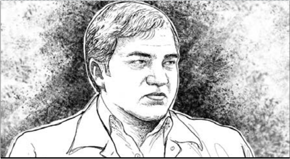
طرح: زین‌العابدین شاهرور