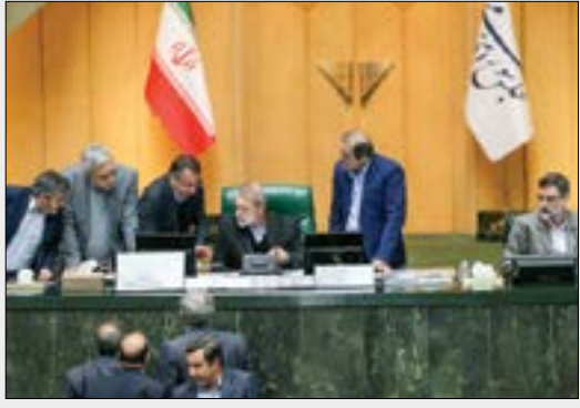
رئیس‌جمهور در نشست خبری

نماینده‌گان مجلس شورای اسلامی در جریان بررسی لایحه درآمد پایدار و هزینه شهرداری‌ها و دهیاری‌ها ماده ۴ این لایحه را تصویب کردند. بر این اساس، شورا‌های اسلامی شهر و بخش می‌توانند در اجرای قانون تشکیلات، وظایف و انتخابات شورا‌های اسلامی کشور و انتخابات شهرداران برای تأمین هزینه‌های شهر و روستا به برقراری و وضع عوارض محلی اعم از عوارض در ساختمان‌ها، مستحذانات، تأسیسات، تبلیغات معابر و فضاهای شهری و روستایی و ارزش افزوده ناشی از اجرای طرح‌های توسعه شهری و روستایی و دارای‌های غیر منقول در محدوده حریم شهر و محدوده روستا اقدام کنند. در ادامه این جلسه، نمایندگان با درخواست رئیس کمیسیون مشترک مجلس برای ارجاع لایحه درآمد پایدار و هزینه شهرداری‌ها و دهیاری‌ها به کمیسیون مشترک به منظور بررسی و الحاق پیشنهادهای موافقت کردند. ●