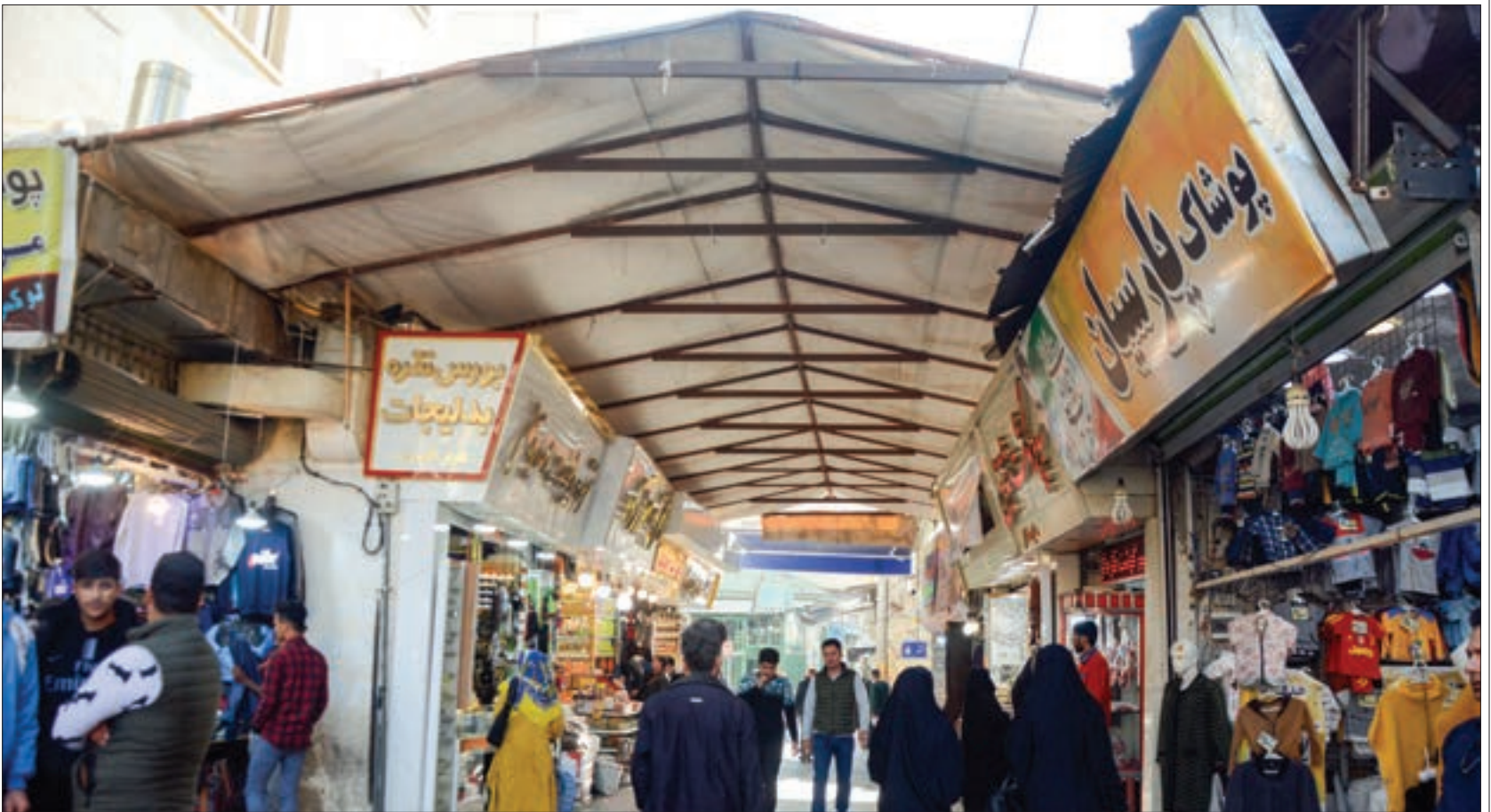
شهردار منطقه ۸ خبر داد