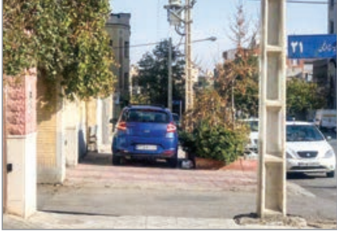
عکس ارسال شده توسط شهروندان خیابان چرامچی