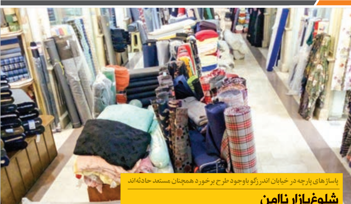
پاساژهای پارچه در خیابان اندرزگو با وجود طرح برخورد همچنان مستعد حادثه‌اند

۱۱۴ تا ۱۱۶ برای گروه‌های حساس ناسالم اعلام شده بود؛ حال آنکه همین شاخص کیفیت در ایستگاه وحدت به ۱۴۸ رسید؛ یعنی ناسالم برای تمامی گروه‌های سنی. گفتنی است؛ تعداد بالای تردد خودرو در هسته مرکزی شهر، یکی از دلایل اصلی آلودگی ایستگاه وحدت در نزدیکی حرم مطهر رضوی است.