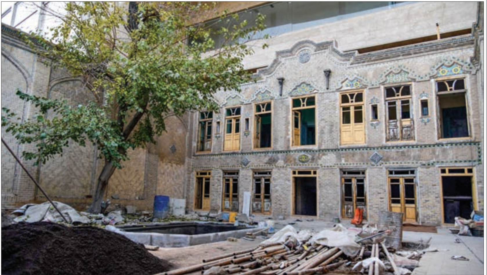
پس از ۵ سال بنای تاریخی امیری بازسازی و مرمت شد