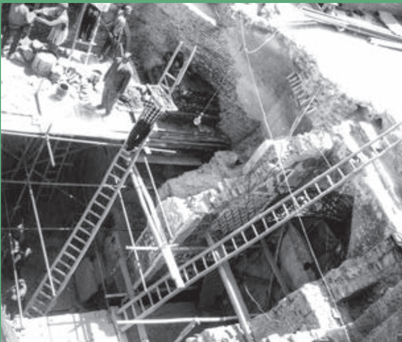
کارگاه برپا شده توسط حبیب الله بنای رضوی برای روسازی در حرم