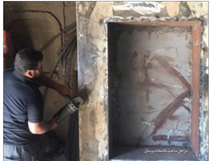
مراحل ساخت کتابخانه بوستان

اقدام در راستای علاقه مند کردن افراد به مطالعه کتاب، همان هدفی است که اعضای جدید شورای اجتماعی محله پایین خیابان به عنوان یکی از برنامه های مهم خود روی توسعه آن دست گذاشته اند. حال بعد از گذشت چند ماه از فعالیت اعضا، نخستین گام در این راستا با راه اندازی کتابخانه رایگان بوستان برداشته شده است. فعالیت این کتابخانه از چند روز آینده در بوستان خطی میر (بین وحدت ۳ و ۵) آغاز خواهد شد.