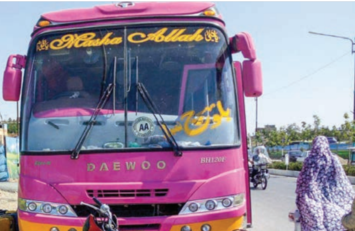
به دنبال اعتراض مردمی و با مصوبه معاونت حمل و نقل و ترافیک شهرداری مشهد

زیرا اگر چنین انقلابی درون فرد رخ ندهد، آسیب بیشتری متوجه او می‌شود. خانواده‌ها باید توجه داشته باشند که ضمن مراعات وضعیت فرزندشان و تشویق او به انجام کارهایی که می‌تواند انجام دهد، منطق و درک صحیح را در وجود او پرورش دهند و از به کار بردن شعارهایی همانند: چه کسی گفته تو معلولیت داری؟ تو هیچ فرقی با دیگران نداری و باید تمام کارهایت را خودت انجام دهی، پرهیزند. این مهم با تشویق و تشبیه‌ها مقصد حاصل می‌شود. یعنی آنجا که فرزند می‌تواند بدون کمک‌کاری رایش برود، اهتمام در ادامه کار در دستور زندگی خانواده واقع شود و آنجا که او نمی‌تواند کاری را انجام دهد اما اصرار به انجام آن دارد، باید تشبیه انضباطی، او را از ادامه مسیر منصرف کنند. در راستای زیست‌پذیری کردن جامعه برای معلولان، گام اساسی باید در نهاد خانواده برداشته شود؛ در ادامه نظام آموزشی و فرهنگی و نهایتاً دستگاه‌های اجرایی.