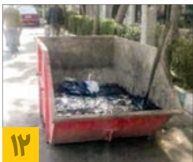
۱۲ لای روبی کانال‌های سرپوشیده منطقه