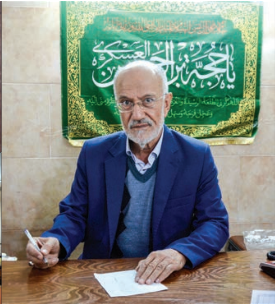
روایتی از مرکز نیکوکاری مهدویت در محله توحید