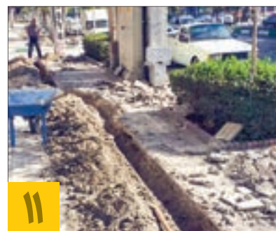
۱۱ اجرای آبیاری مکانیکی در بوستان امیر