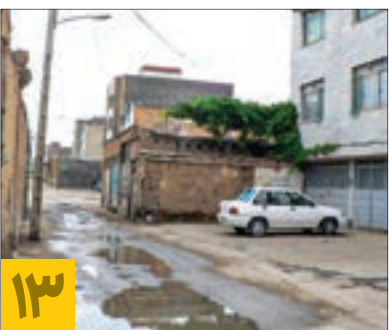
۱۳ معابر حسین باشی در اولویت عقب‌نشینی نیست

« معاون فنی و اجرایی شهرداری منطقه ۲ از آبیاری مکانیکی فضای سبز بوستان امیر خبر داد و گفت: این پروژه با هدف جداسازی آب شرب از آب خام انجام شد.