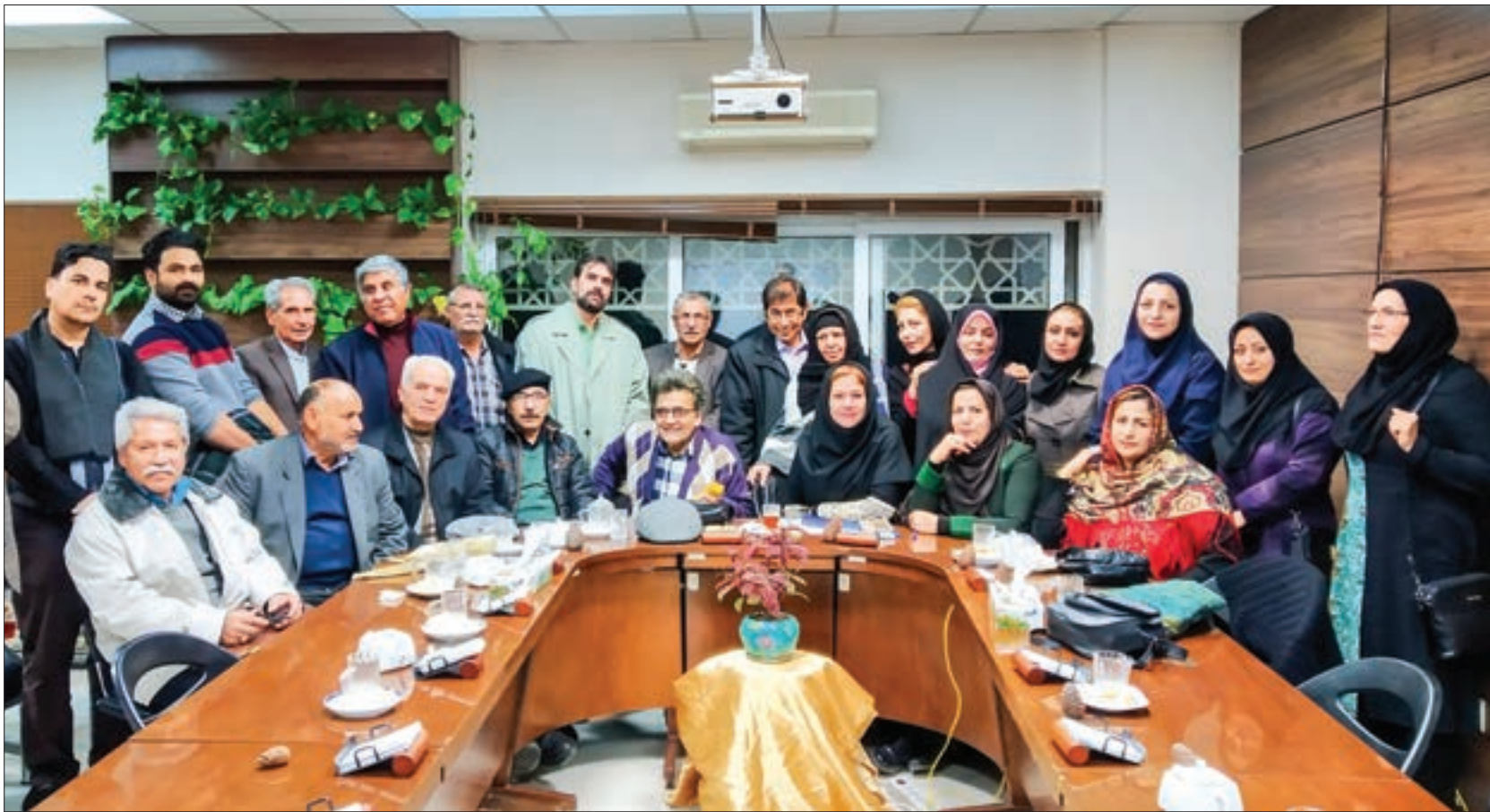
نشست شعر ارغوان یک ساله شد