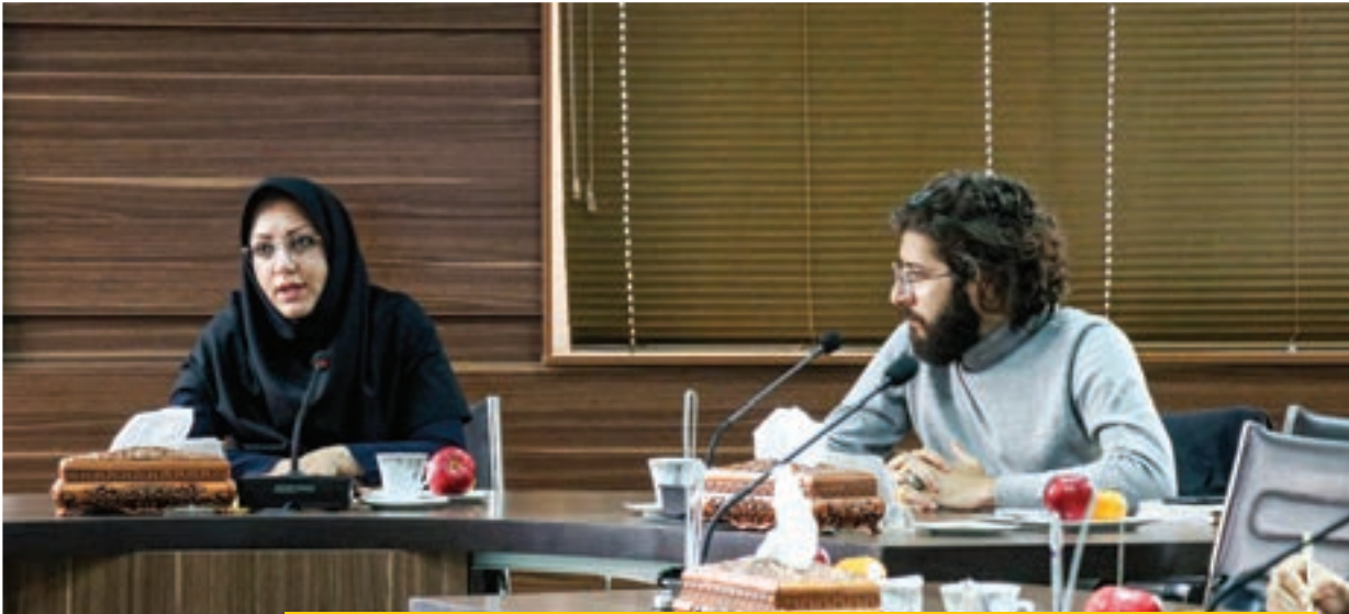
سرپرست شهرداری منطقه مطرح کرد

مسئولان آموزش و پرورش ناحیه ۶ ضمن حضور در هنرستان شهید کاظمیان از کارگاه‌های هنرآموزان و هنرجویان بازدید کردند. به گزارش شهر آرا محله، در ادامه بازدید مسئولان آموزش و پرورش ناحیه ۶ از مدارس منطقه، جوانشیری مدیر و دیگر مسئولان آموزش و پرورش ناحیه ۶ شهرستان مشهد از هنرستان شهید کاظمیان بازدید