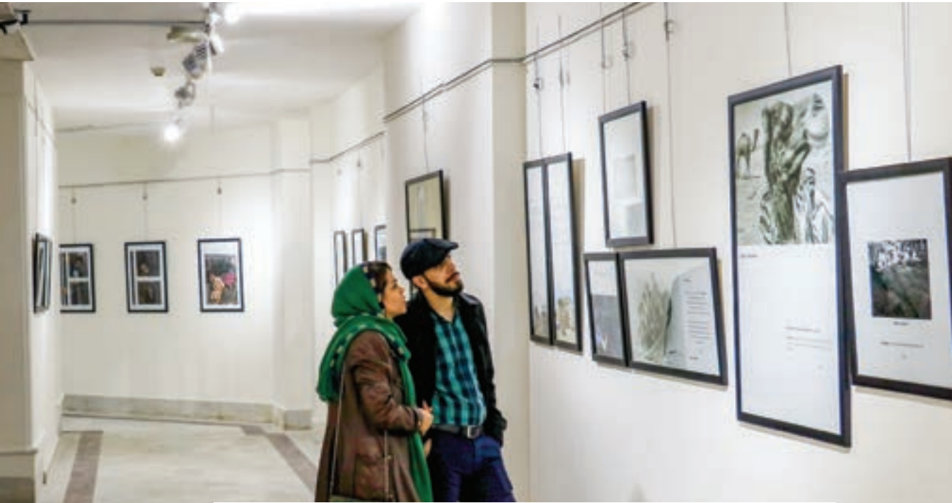
گزارشی از نمایشگاه عکس نگارخانه بوستان ملت