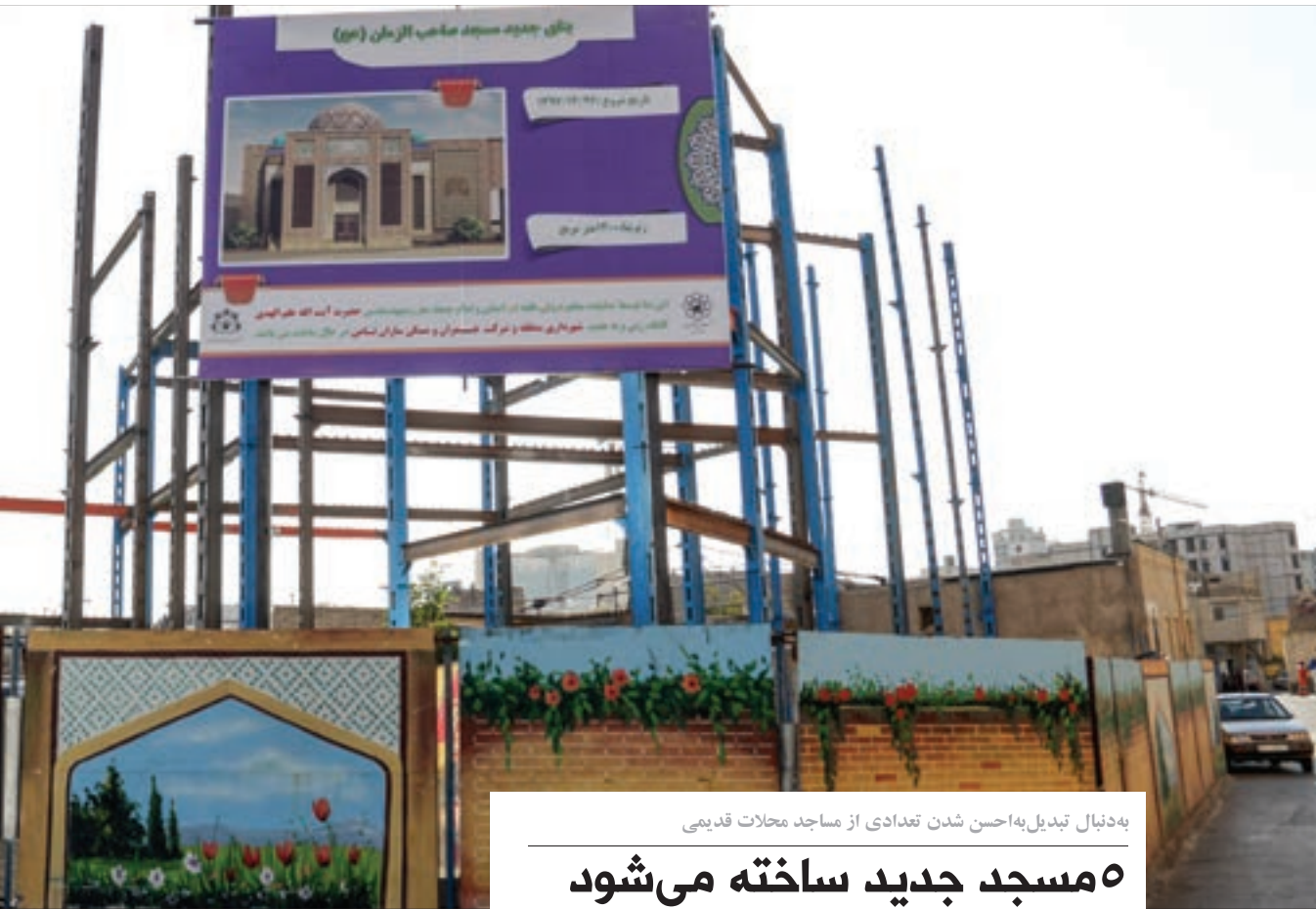
به دنبال تبدیل به احسن شدن تعدادی از مساجد محلات قدیمی