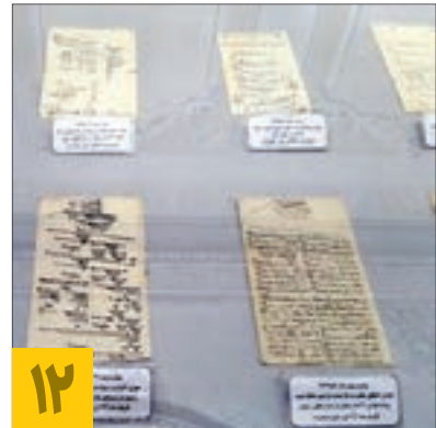
۱۲ ثبت گنجینه‌های تاریخی حرم مطهر در حافظه جهانی یونسکو