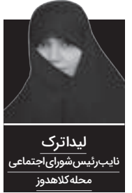
لیداترک نایب رئیس شورای اجتماعی محله کلاهدوز

مقام معظم رهبری به جوان گرایسی در تمام عرصه ها تأکید دارند و استفاده از ظرفیت های کشور را نیازمند حرکت آتش به اختیار جوانان می دانند. همان طور که خاطر نشان کردند: «گروه های جوان مؤمن و انقلابی باید هر کاری را که امکان پذیر است در چهار چوب قوانین و مصلحت کشور انجام دهند». در تمام انقلاب ها و نهضت ها جوانان جایگاه ویژه ای دارند و در طول تاریخ بشریت جلودار مهم ترین اتفاقات سیاسی و اجتماعی جوانان بوده و جلوتر از دیگران در عرصه سازندگی فرهنگی حرکت کرده اند. در صدر اسلام نیز دشوارترین مأموریت ها از سوی پیامبر (ص) بر دوش جوانان سپرده می شد و حضرت به قدری به جوان گرایسی اهمیت می دادند که گاهی سابقه داران به اعتراض می پرداختند.